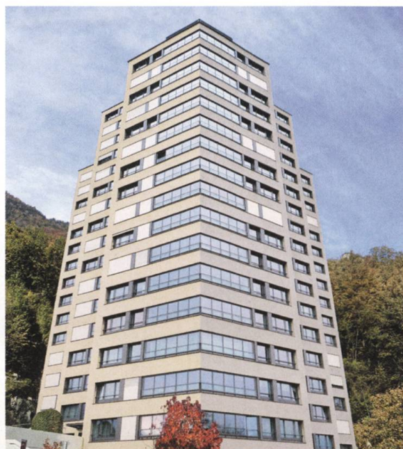
Hochhaus Schiller, Brunnen