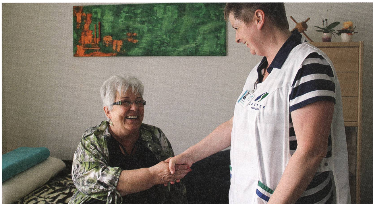
Herzlich, freundschaftlich und professionell.

10:20 Uhr: Pflegefachfrau 2 war inzwischen in Stansstad bei Frau F. zur Wundbehandlung. Frau F. hat Krampfadern und deshalb schlecht durch-