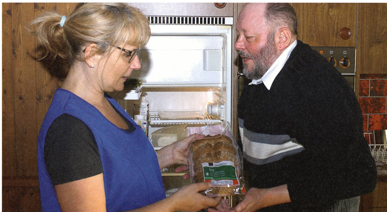
Den Käse in den Kühlschrank oben links, das Tessinerbrot in den Brotkasten. Wer blind ist, muss Ordnung halten.

Eine schwierige Aufgabe! Vor allem die Konstanz bereitet der Spitex Mühe, da die meisten Mitarbeiterinnen Teilzeit arbeiten. Was zu Klagen führt: zu häufig würde das Personal wechseln. Nicht alle Leute zeigen sich zufrieden mit der Spitex. Das