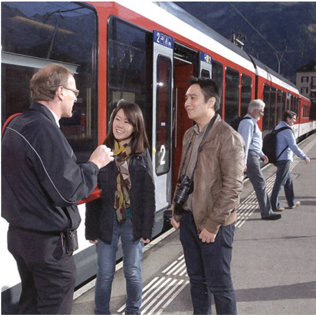
Nice to have you here: Touristen sind gut aufgehoben.

Und mittendurch fährt die Zentralbahn, deren Trasse viele Bauern mit ihren Traktoren überqueren müssen, um von der einen Parzelle zur anderen zu gelangen. Eine weitere Herausforderung ist die unmittelbar parallel zum Trasse verlaufende Autostrasse: Denn wird ein Bahnübergang mit einer Schranke gesichert, erfordert das die Schaffung von Warteräumen für die Automobilisten. Das braucht Land und ist teuer.