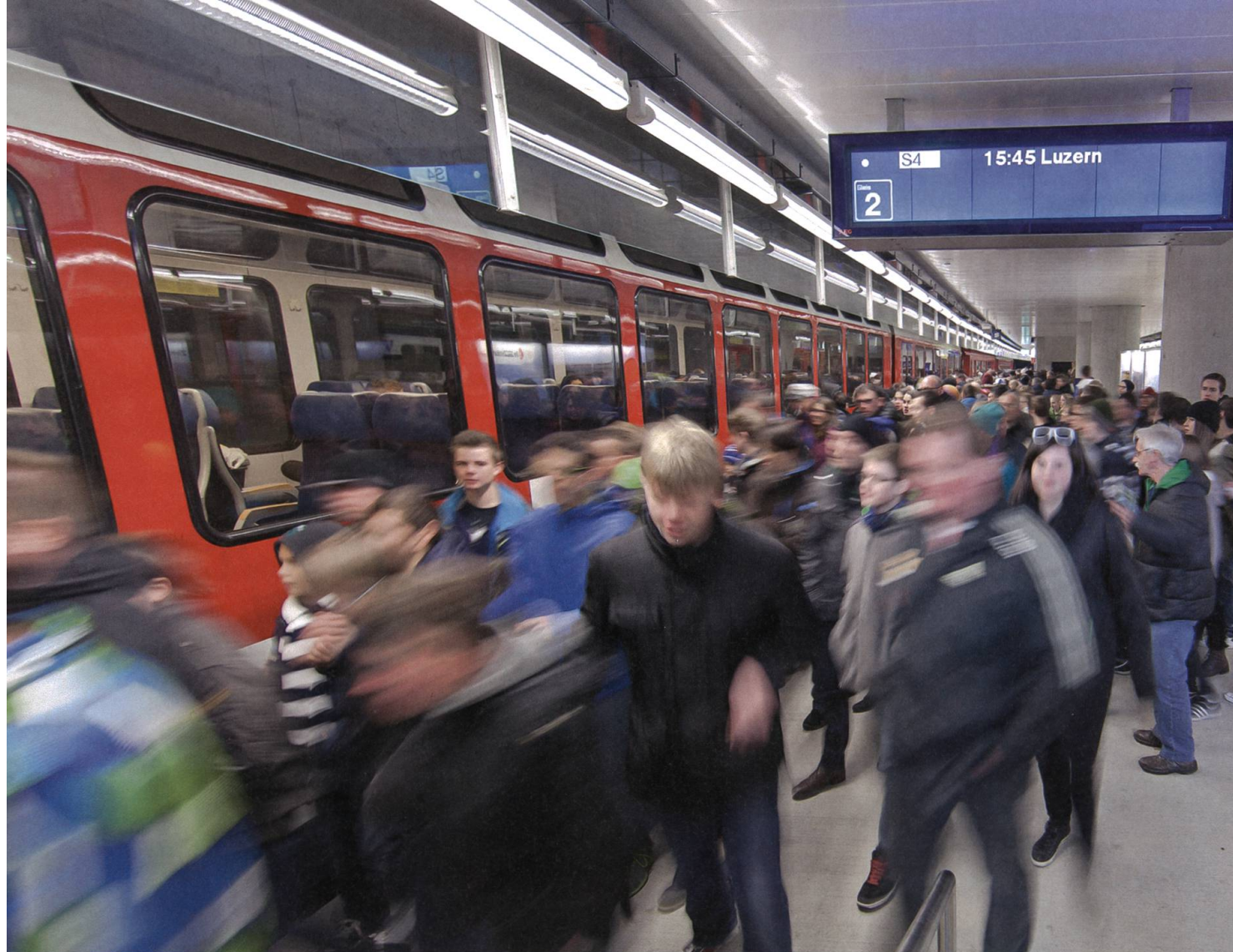
Unterirdisch: Die Haltestelle Luzern Allmend/Messe ist modern gebaut und ermöglicht effizienten Verkehr.

unterirdischen Bahnhof der Zentralbahn und der Zentralschweiz. Ein geradezu futuristisch anmutender, urbaner Bau. Von dort gehts weiter bis Kriens Mattenhof, eine im Dezember 2004 neu in Betrieb genommene Haltestelle. Beide Stationen werden im Verlauf unserer Reise nochmal eine Rolle spielen. Aber vorerst fahren wir weiter nach Horw, und im Haltiwaldtunnel an der Kantons-grenze zwischen Luzern und Nidwalden kommen wir zur Frage, warum die Luzern–Stans–Engelberg-Bahn und die Brünigbahn überhaupt fusio-nierten. Und wem die Zentralbahn gehört. Die Brünigbahn wurde von den SBB erbaut und 1888 in Betrieb genommen. Die LSE hingegen war seit jeher eine Privatbahn: Sie wurde 1898 als Ver-bindung von Stansstad nach Engelberg gegründet und blieb privat, als daraus 1964 mit der Verlän-gerung nach Hergiswil die LSE wurde. Die LSE