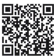
QR-Code zum Film.