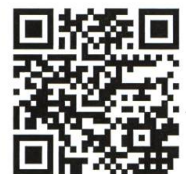
QR-Code zum Artikel Tunnel Engelberg.