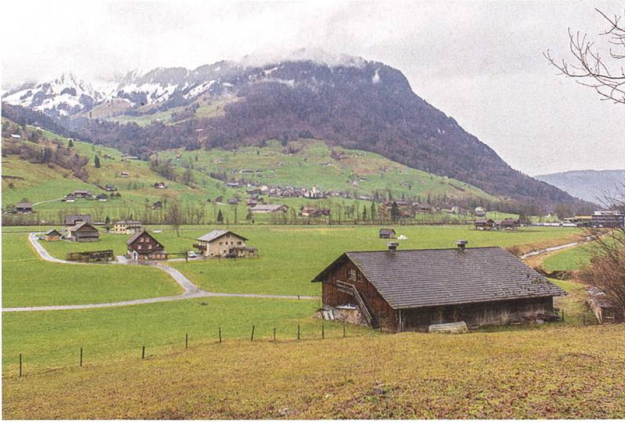
Der Ennetacher in Wolfenschiessen (vorne): Hier kommt der Lehrbienenstand unter.

dessen Garten bis vor kurzem das Bienenhaus stand – «wie vor jedem Bauernhaus, wirklich jedem. Ein Bienenhaus gehörte einfach dazu.» Heute sind seine achtzehn bis zwanzig Völker gleich beim Gaden zu Hause, einen Steinwurf vom Haus entfernt, weitere fünf Völker hat er in Dallenwil. «Ein grosser Vorteil, die Bienen so nah zu haben. Man hat sie ständig im Auge und weiss so immer, wie sie zwäg sind.»