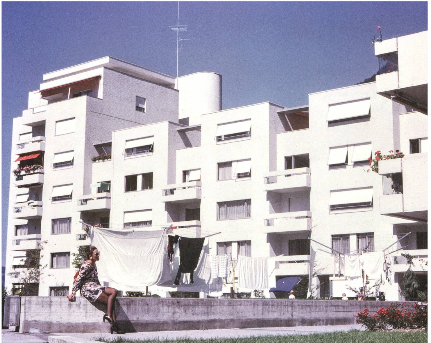
Nach Westen schliesst der Turmatthof mit einem Wohnturm ab.

und ins Stadtzentrum nimmt zu, und damit auch der Verkehr.