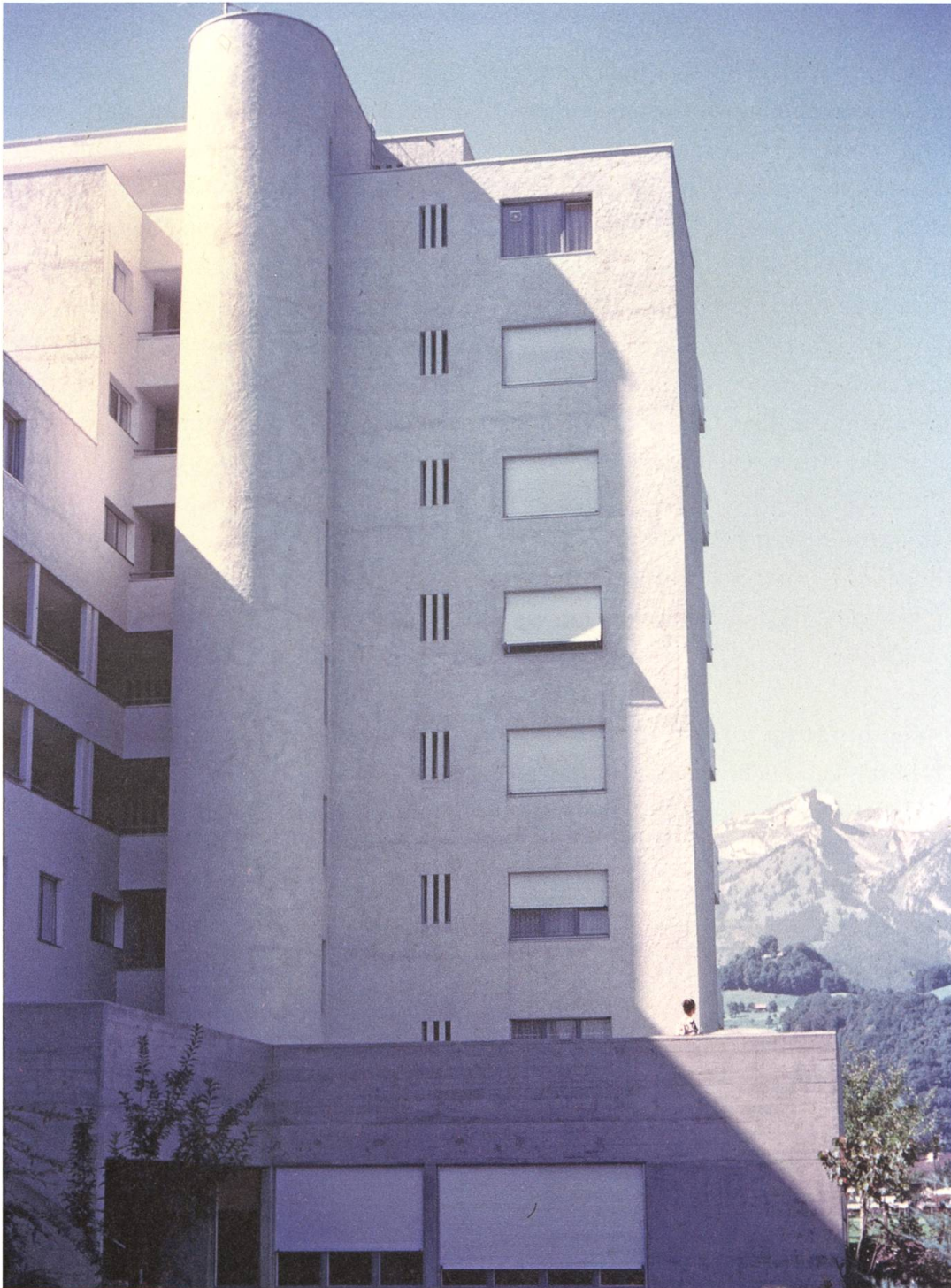
Übernahme von Motiven des Modernen Bauens: Treppenhaus im Wohnturm.

Insbesondere der Architekt Arnold Stöckli hat sich intensiv mit theoretischen Fragen des Städtebaus auseinandergesetzt. Er kannte das Leben in den Städten Berlin, Mailand, Stuttgart, Wien oder Zürich aus eigener Erfahrung.