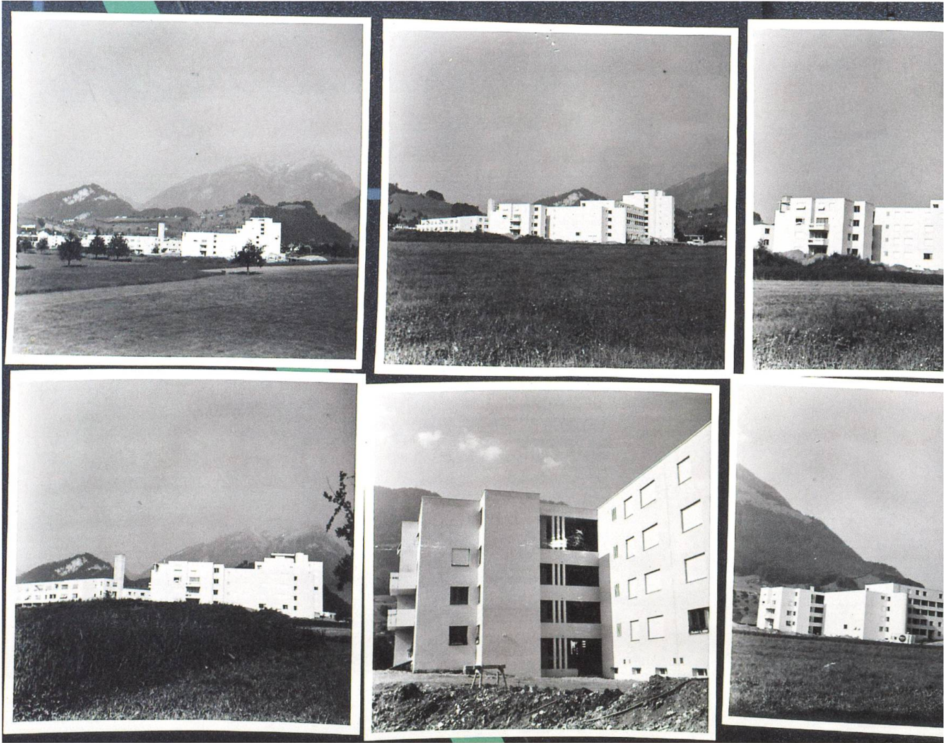
Der Turmatthof präsentiert sich kurz vor Fertigstellung der ersten Bauetappe 1968 als wichtiger Beitrag...