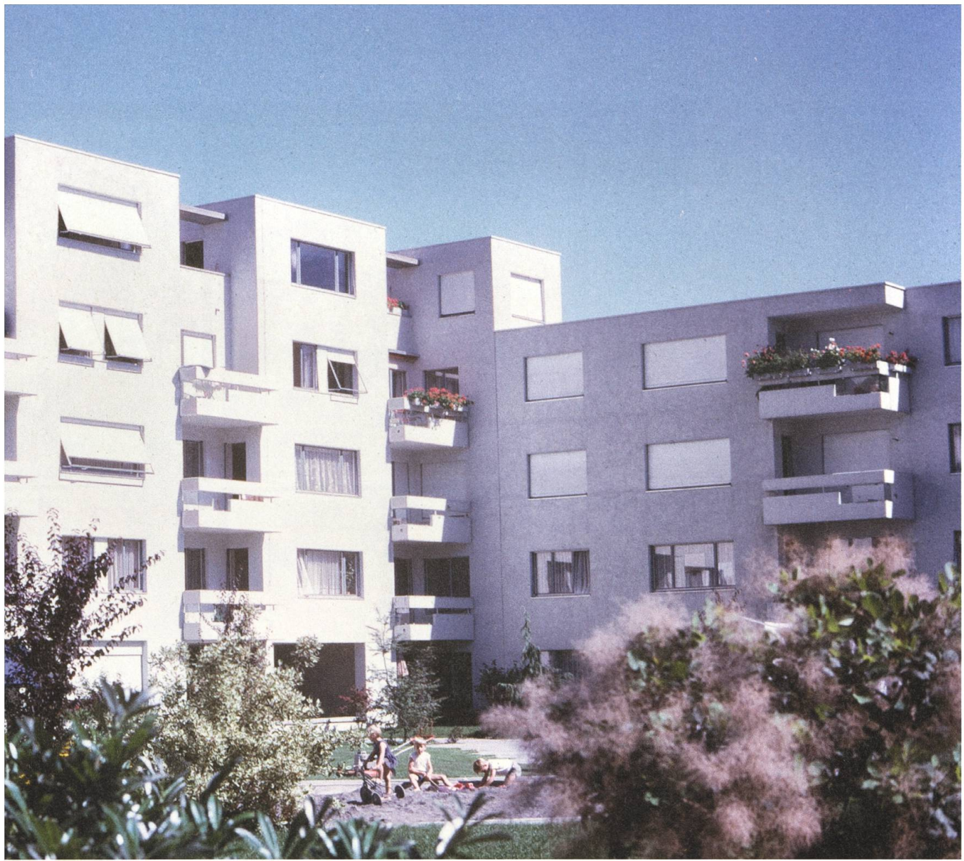
Die nach Süden ausgerichtete Wohnzeile wird durch die vorspringenden Gebäudetrakte gegliedert.

Stöckli führte den Wandel darauf zurück, dass die spätere Generation dem Reformgedanken der 1960er-Jahre nicht mehr folgen konnte. Für die Aussensanierung der Bauten Ende der 1980er-Jahre wurden die Architekten nicht beigezogen. Die neue Eternitverkleidung wertete Stöckli als eine Kritik seiner Architektenkollegen an seiner Architektur. Nach der missglückten Sanierung hatte er den Turmatthof nicht mehr sehen wollen. Der Turmatthof, ein Bau der Nachkriegsmoderne, wies ursprünglich aussen verputzte, weiss gefasste Oberflächen auf. Der heute mit grauem Eternitschiefer verkleidete Bau mit den gelben Fenstern ist einem postmodernen Architekturverständnis geschuldet und wird dem Original nicht gerecht. Um dem Turmatthof seinen originalen