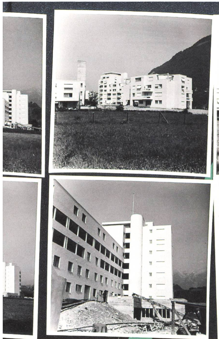
... zur zweiten Moderne in der Zentralschweiz.

kannte die «Mustersiedlung des Neuen Bauens» aus eigener Anschauung. Neubühl wird bis heute von einer Genossenschaft verwaltet. Sie stand daher den Architekten aus gesellschaftspolitischen Gründen näher als die eigentumsorientierte Siedlung Halen.