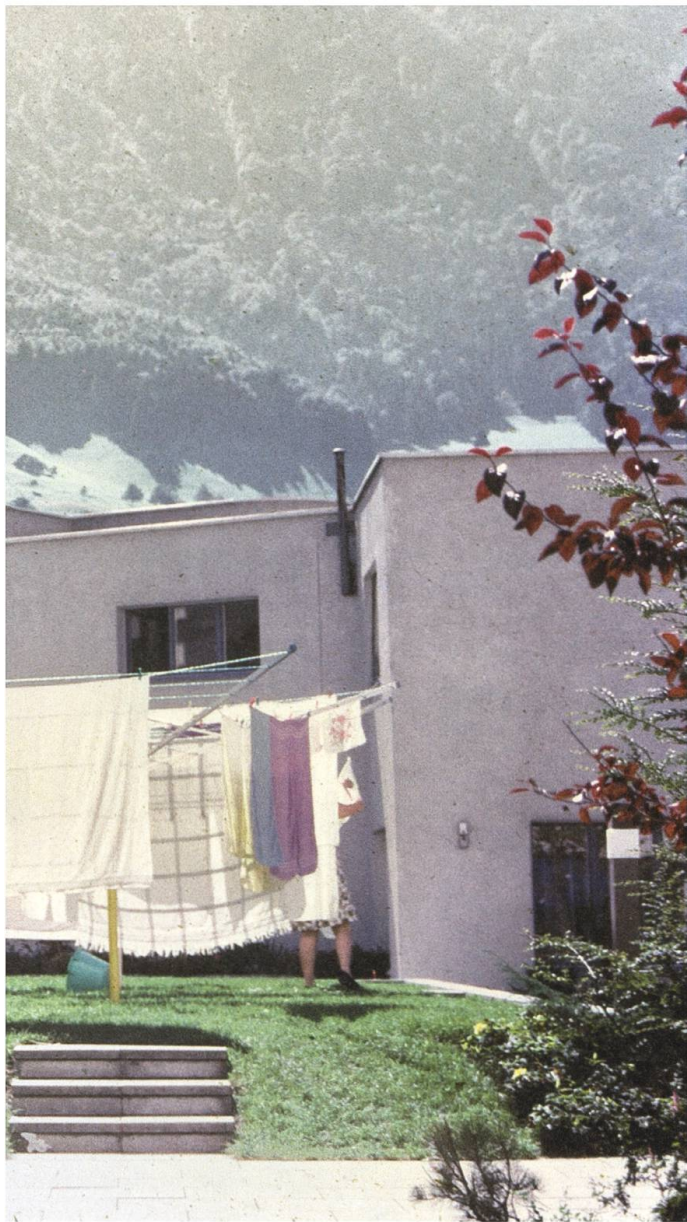
... viel Licht in den Hof.