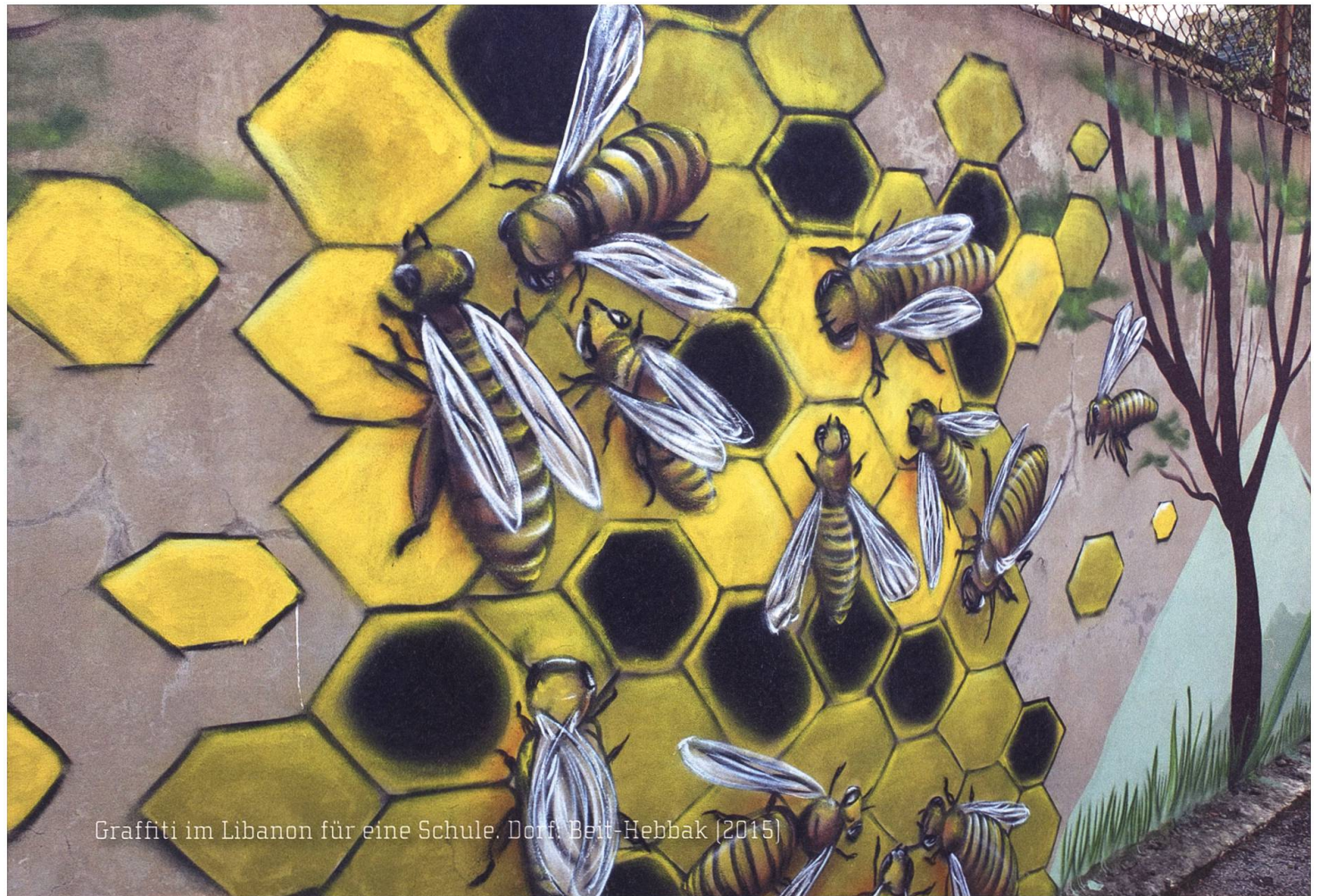
Graffiti im Libanon für eine Schule. Dorf: Beit-Hebbak [2015]