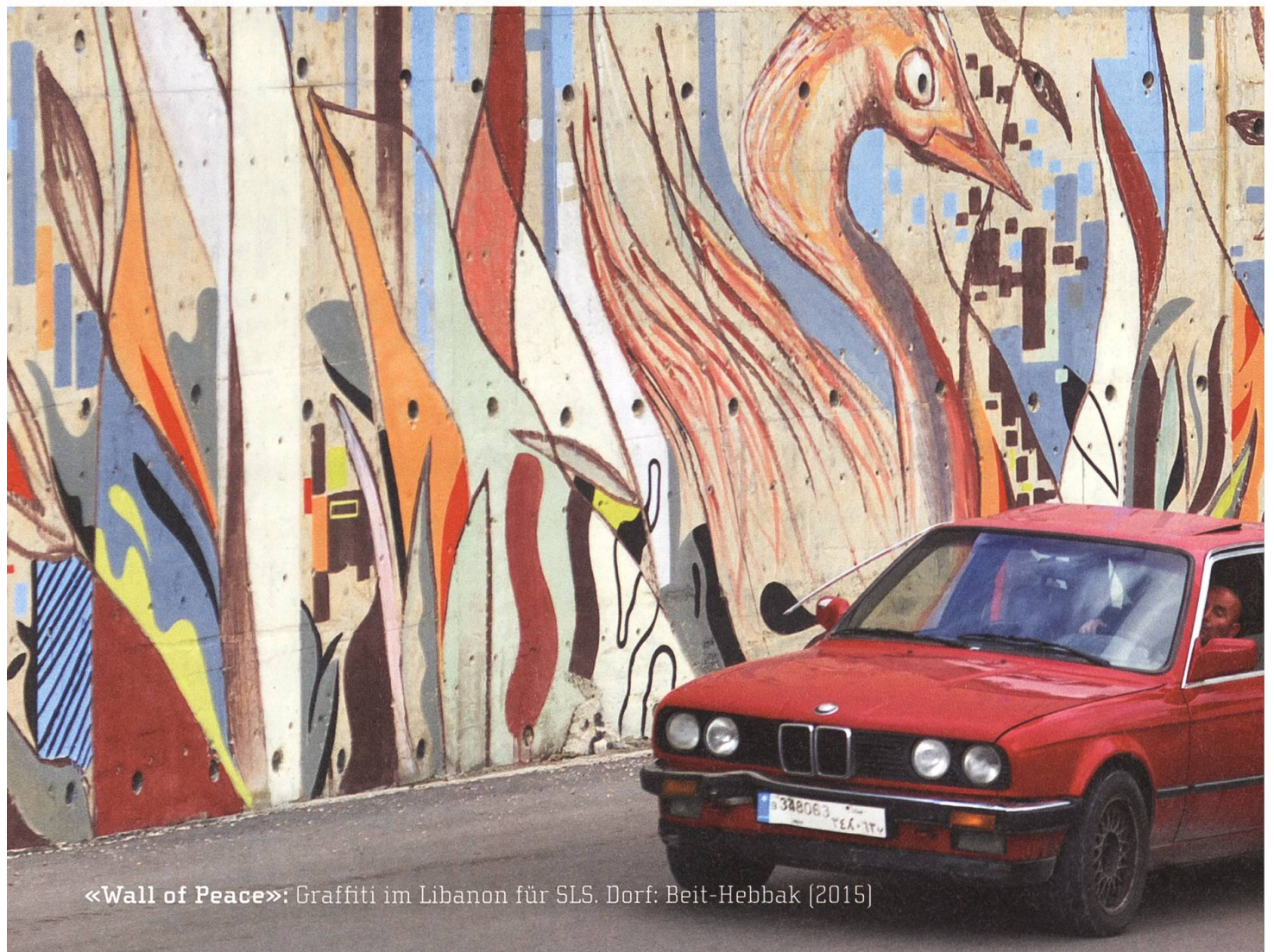
«Wall of Peace»: Graffiti im Libanon für SLS. Dorf: Beit-Hebbak (2015)