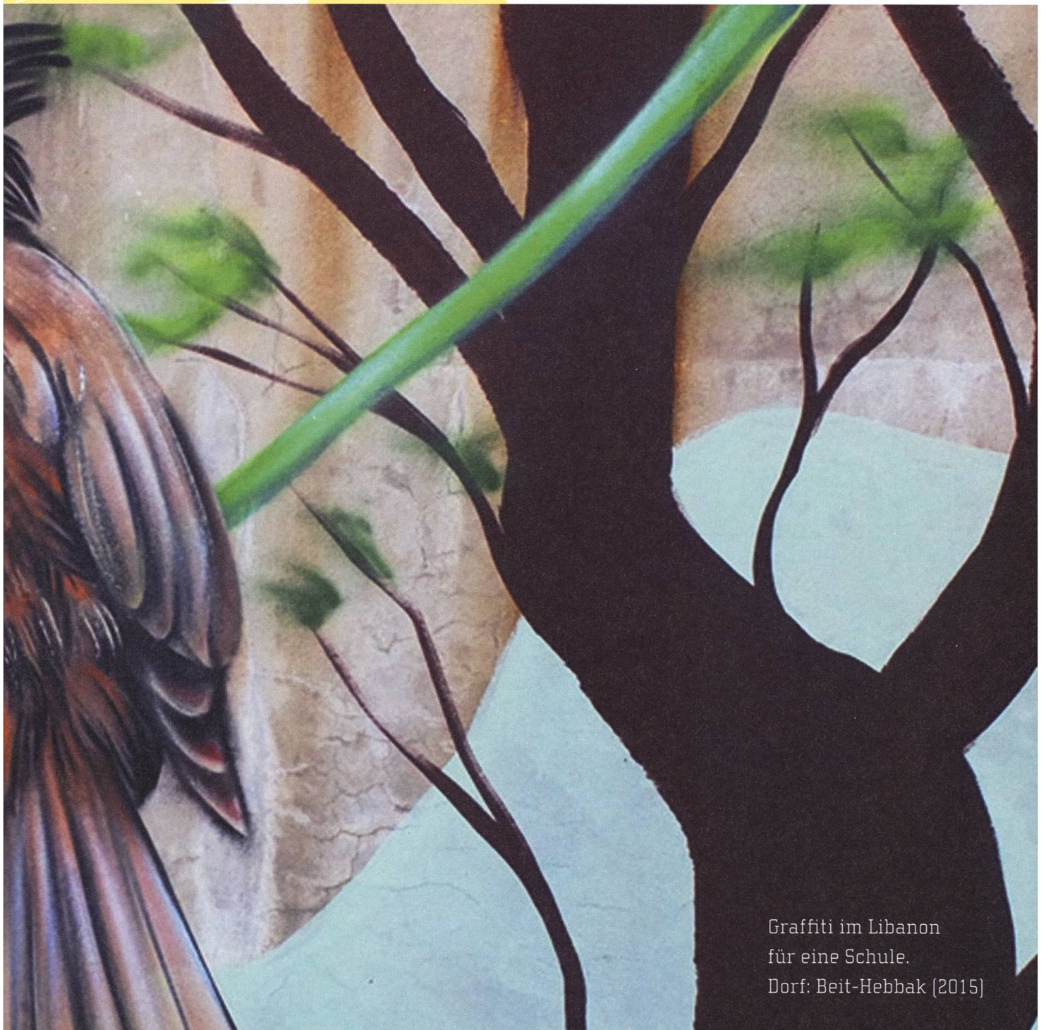
Graffiti im Libanon für eine Schule. Dorf: Beit-Hebbak (2015)