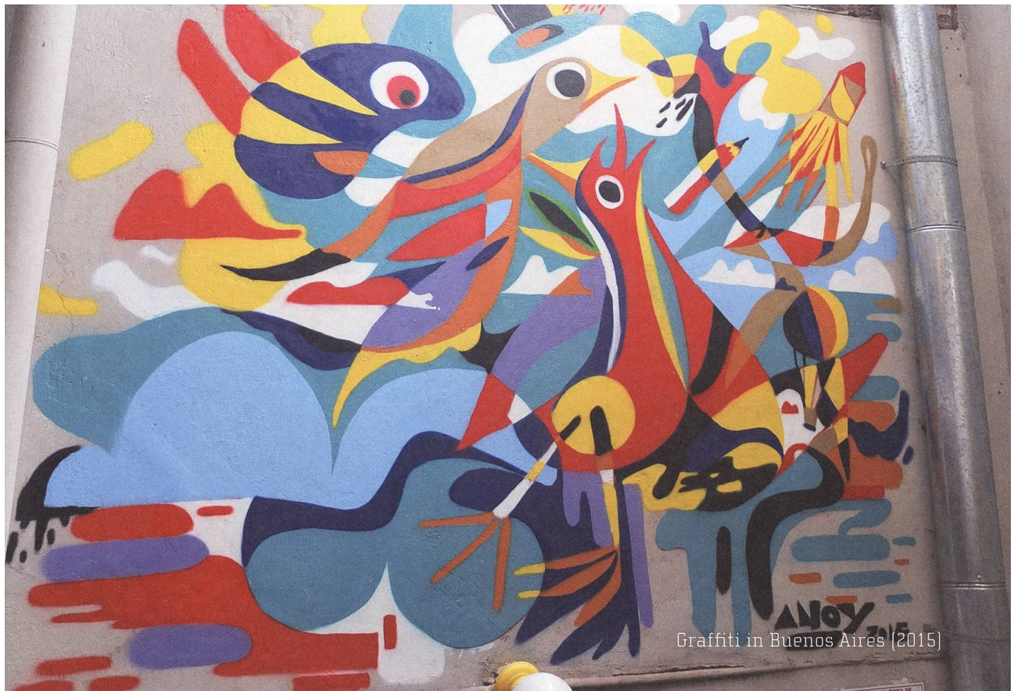
Graffiti in Buenos Aires (2015)