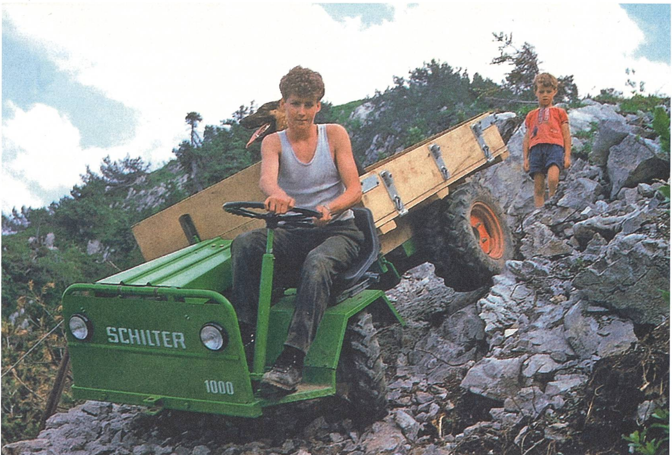
Probefahrt – wahrhaftig über Stock und Stein – mit einem Prototyp des Typs 1000.