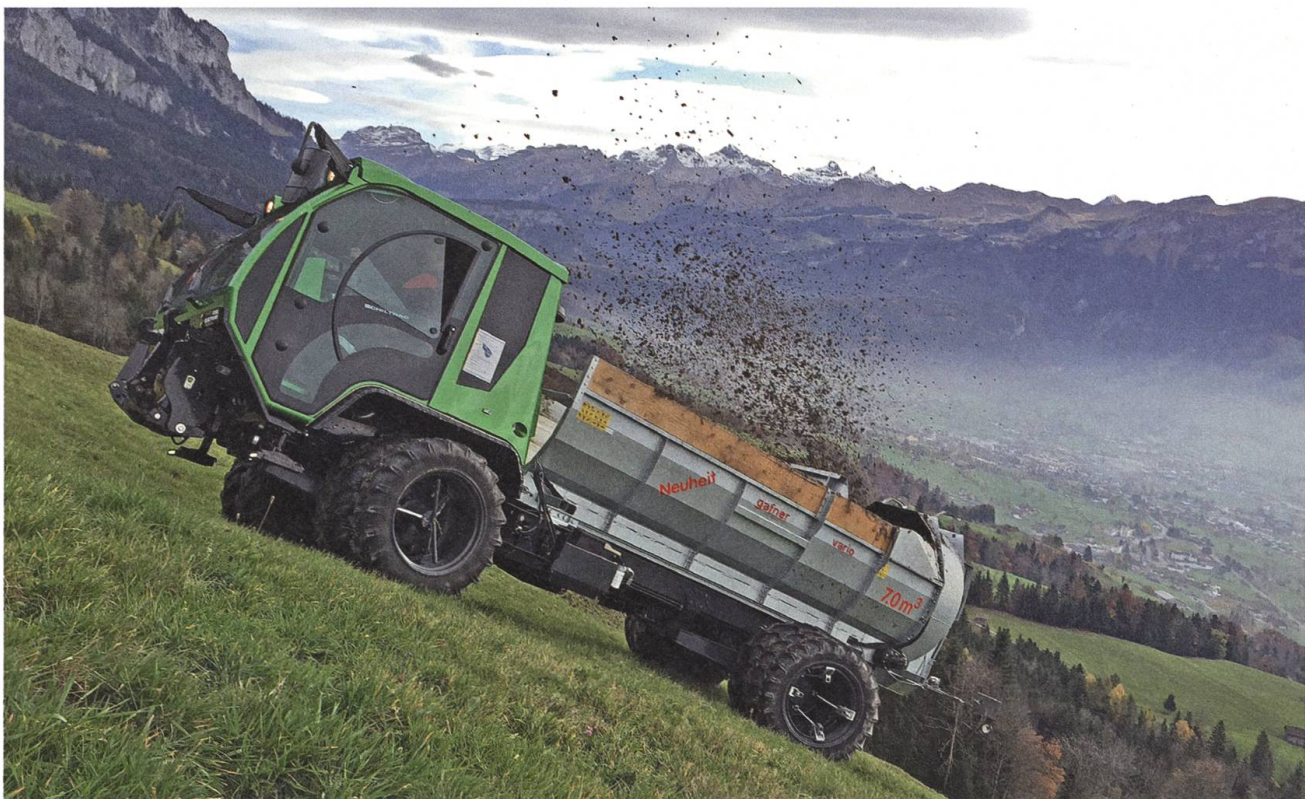
Für den «Alpenporsche» bedeuten auch steilste Hänge kein Problem.