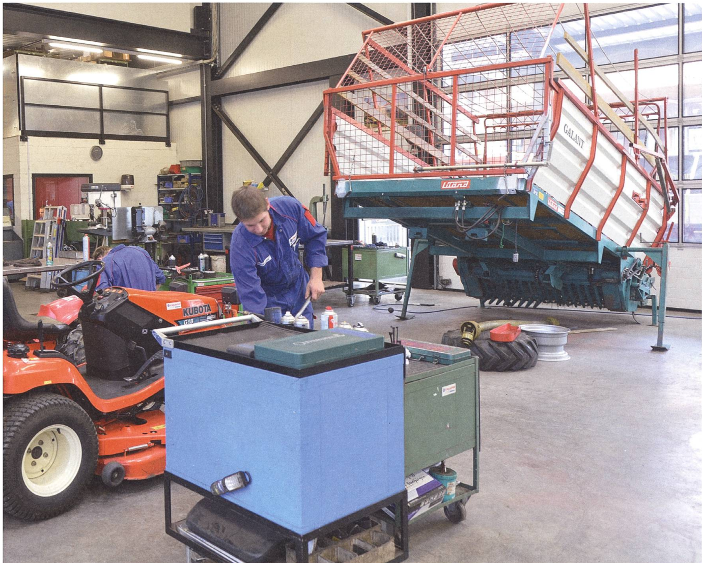
In der Werkstätte von Schiltrac ist Präzisionsarbeit gefragt.

erklärten: «Genau den Eurotrans brauchen wir für den Winterdienst auf dem Flughafen Zürich.» Wie es sich für einen agilen Nischenplayer gehört, fackelte die Schiltrac GmbH nicht lange und machte sich sofort an die Arbeit.