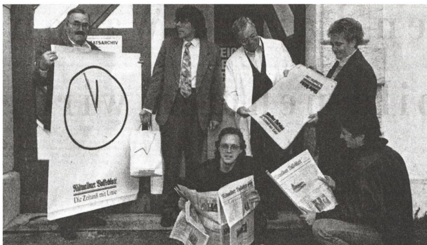
Das Redaktionsteam brachte die letzte Ausgabe des «Nidwaldner Volksblatts» vom 31.10.1991 ins Staatsarchiv.