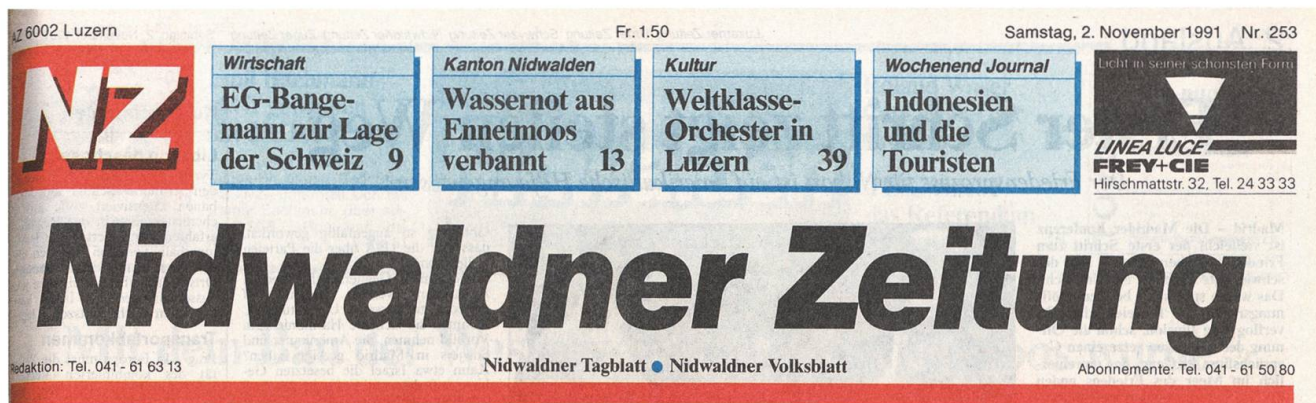
Die erste Ausgabe der «Nidwaldner Zeitung» erschien am 2.11.1991. Sie führte noch während einiger Zeit das «Nidwaldner Tagblatt» und das «Nidwaldner Volksblatt» im Zeitungskopf.

Die Gesellschaft Nidwaldner Volksblatt war damit völlig aus der Verleger-Verantwortung entlassen. Es stellte sich die Frage nach ihrer künftigen Aufgabe. In den ersten Jahren ging es darum, das Zusammengehen mit dem «Vaterland» zu begleiten und für eine gute Regionalberichterstattung in und über Nidwalden einzutreten.