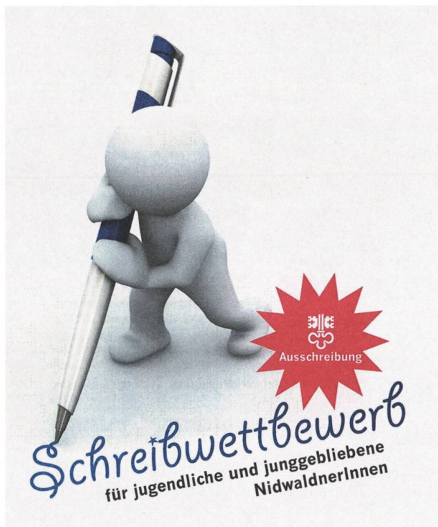
Flyer für den Schreibwettbewerb der GNV von 2009.