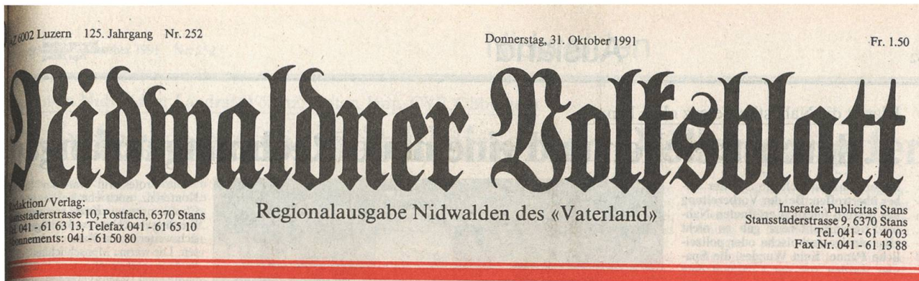
Kopf der letzten Ausgabe des «Nidwaldner Volksblatts» vom 31.10.1991.