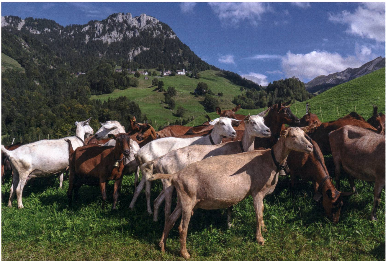
Die Wandfluh-Ziegen haben freie Sicht auf das Klosterdorf Maria-Rickenbach.