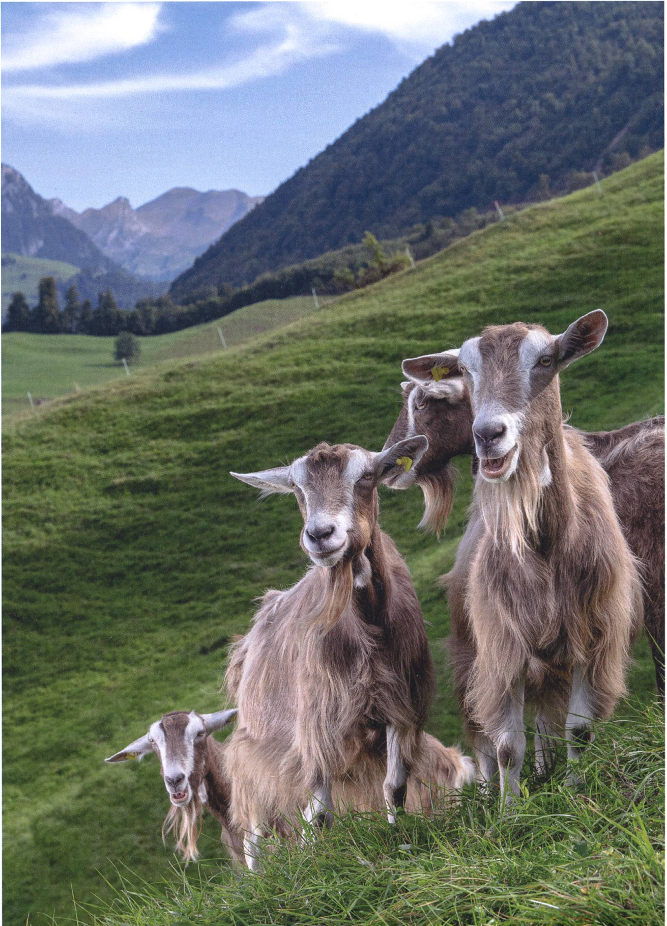
Die Toggenburgerinnen von Toni Odermatt weiden ihr Geissenleben lang am Fuss des Stanserhorns.