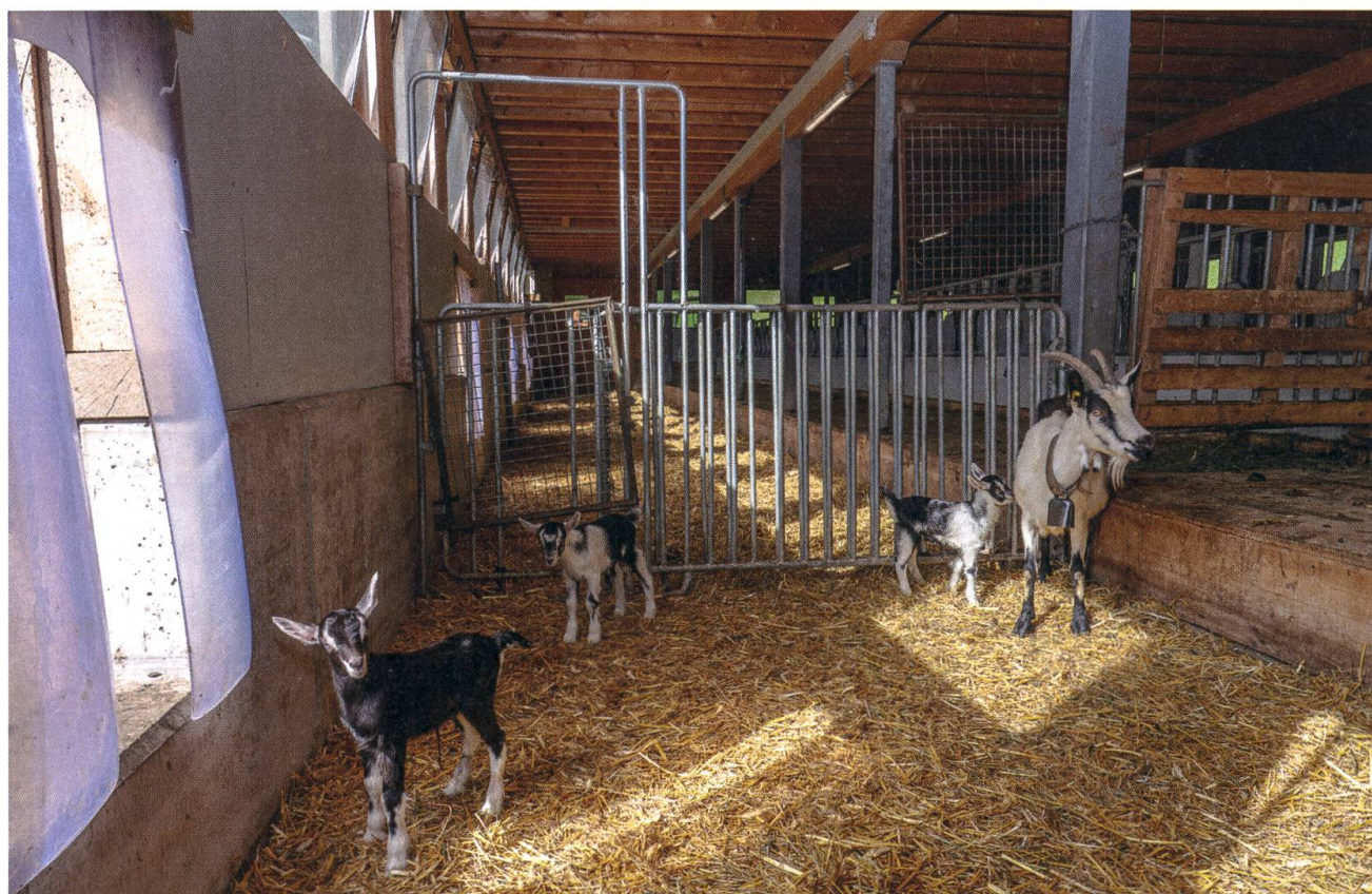
2018 zogen die Ifängi-Geissen in ihren grosszügig dimensionierten Laufstall ein, wo sie die Nächte verbringen.