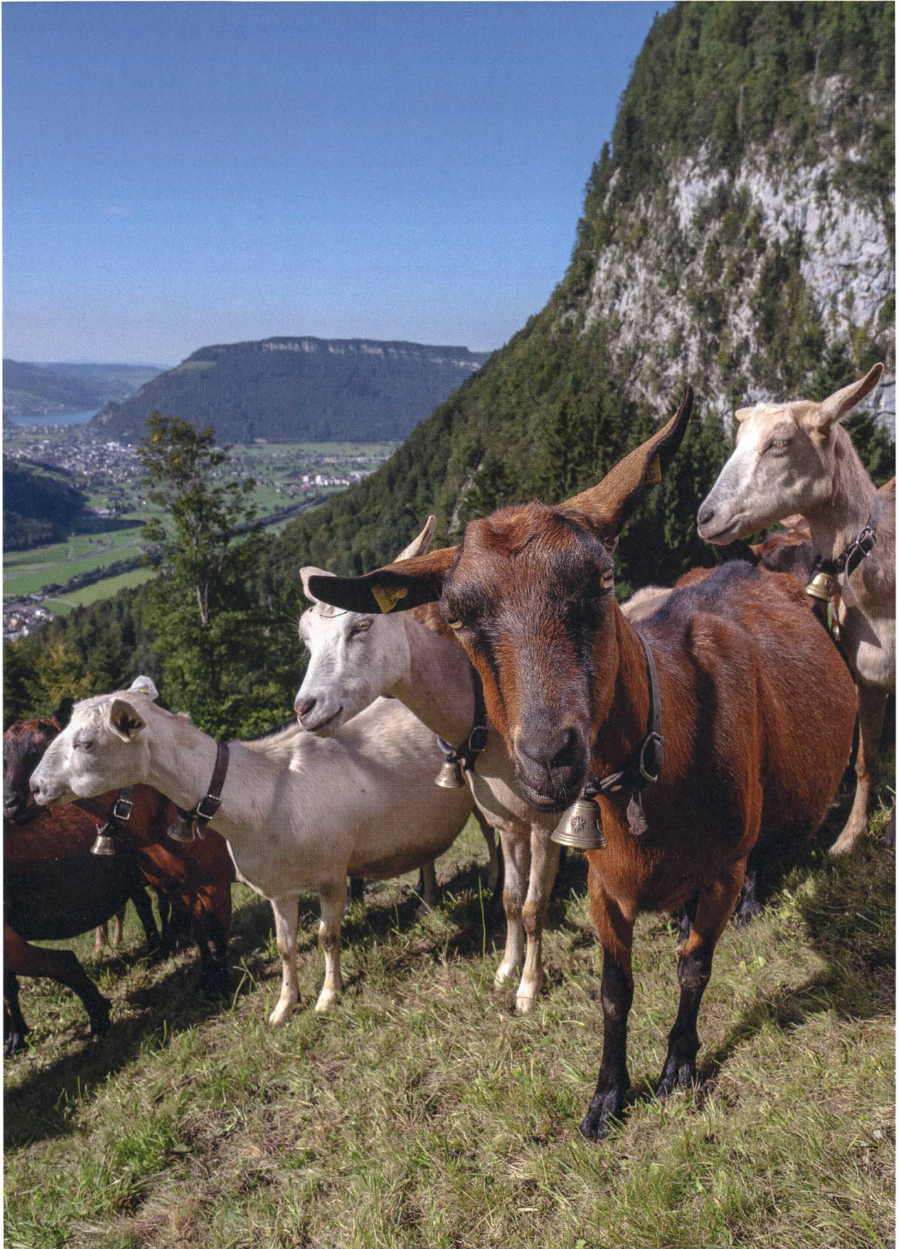
Die Wandfluh-Geissen (oben) haben einen Postkarten-Blick aufs Engelbergertal. Vordere Seite: Strahlenziege-Mutter mit Neugeborenen vom Ifängi-Biohof.