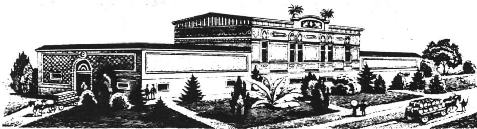
Malaga-Kellerei Lenzburg 1889-1986