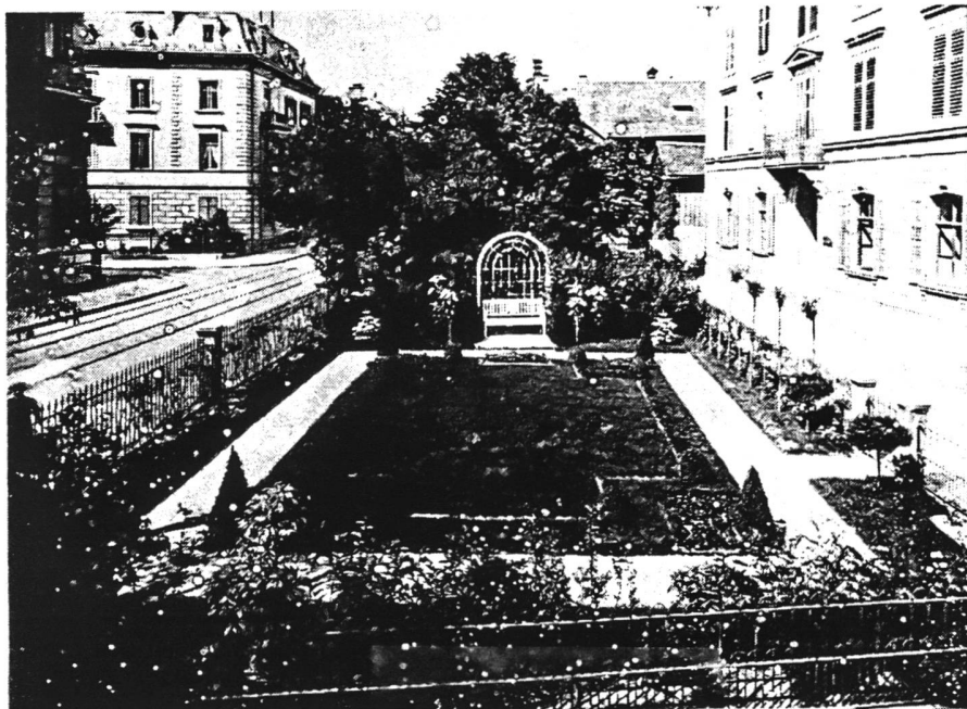
Un jardin zurichois, rasé en 1930

Cette société entend éveiller l'attention de larges cercles sur l'art des jardins tout en trouvant l'oreille des autorités afin que la valeur culturelle des jardins et parcs soit reconnue. En effet, le caractère de plusieurs villes et agglomérations est déterminé par les espaces verts qui contribuent au bien-être des habitants. Ces amoureux des jardins ne souhaitent pas seulement défendre les espaces verts et les plantes que l'on y trouve, mais espèrent aussi relancer les recherches historiques sur les parcs et jardins (sauvegarde des sources iconographiques et manuscrites). Les membres de cette société collaboreront avec des bibliothèques et des instituts qui pourraient rassembler et tirer parti de documents, revues et autres sources concernant les parcs et jardins. Il ne s'agit pourtant pas de tomber dans la nostalgie et de n'admirer que les splendeurs passées: l'art du jardinage doit être développé et affiné dans l'esprit de notre temps. La société pour l'art des jardins organisera dans cette esprit diverses manifestations.