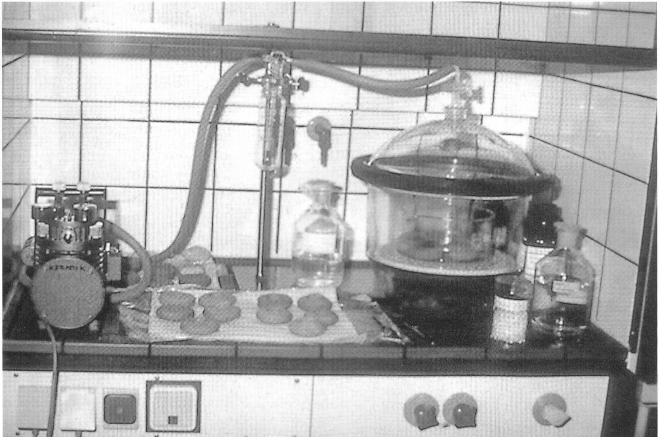
Konservierung der Donuts im Exsikkator

ton (1 T) getränkt. Um ein optimales Eindringen zu gewährleisten, nahm der Viskositätsgrad allmählich zu, von einer zunächst 10%igen zu einer 30%igen Lösung.