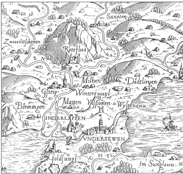
Eine Welt ohne Strassen, aber mit allen bestehenden Brücken zeigt die Berner Karte von Thomas Schoepf (1577/78; Ausschnitt Interlaken).

nisse, die für manche bedeutende Flussübergänge erhalten geblieben sind, besitzen wir heute detaillierte Informationen über das Verkehrsaufkommen sowie die Art und Menge der transportierten Güter auf einer bestimmten Route.