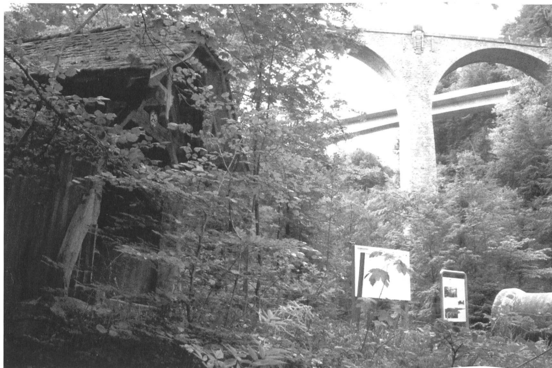
Drei Brücken aus verschiedenen Zeiten überspannen das Lorzetobel bei Zug auf unterschiedlicher Höhe: die Holzbrücke der alten Landstrasse von 1759, das rund 60 m hohe Bogenviadukt von 1910 und die aktuelle Betonbrücke von 1985.

Bei den Brücken kristallisierte sich also das Verkehrsgeschehen, darum sind sie für die historische Wegforschung von grosser Bedeutung. Sie lenkten die überregionalen Verkehrswege, beeinflussten die Siedlungsentwicklung, bestärkten die Machtstellung der Herrschenden und bestimmten den Markt einer Stadtgemeinde. Mit dem Bau neuer Brücken versuchte man den Verkehr auch bewusst zu steuern. Dank der Brückenzollverzeich-