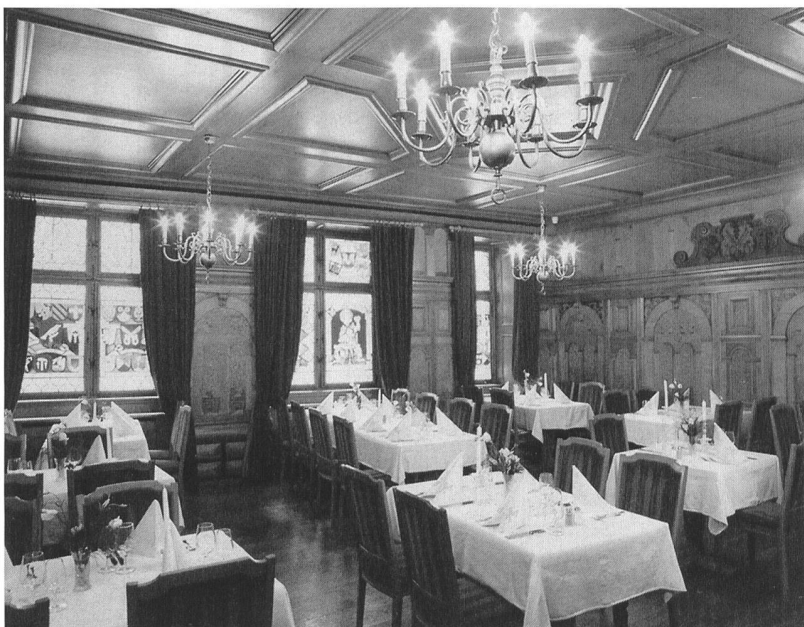
Restaurant Löwenzorn, Basel