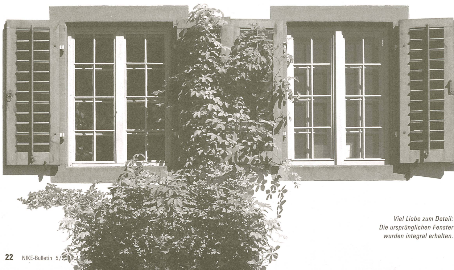
Viel Liebe zum Detail: Die ursprünglichen Fenster wurden integral erhalten.