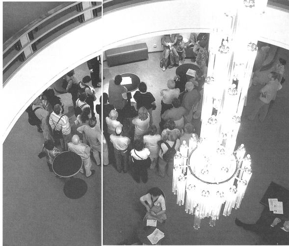
Die Führungen im Lausanner Ensemble «Bel-Air Métropole» (1929–1932) , dem ersten Wolkenkratzer der Schweiz, stiessen auf reges Interesse.

Mentions quelques moments mémorables: Les nombreuses «portes ouvertes» organisées dans la petite ville thurgovienne d'Arbon ont attiré près de 1200 personnes. À Winterthur-Hegi, le Château de Hegi et l'ancienne scierie ont accueilli 1300 visiteurs, alors que le «Hallenstadion» de Zurich – qui était à l'époque de sa construction le stade couvert le plus grand et le plus moderne d'Europe – en attirait à lui seul près de 250. Dans la Principauté du Liechtenstein, au Château de Balzers, 3000 visiteurs se sont informés sur les perspectives d'avenir de l'ancienne demeure du mimesinger Henri II, Baron de Frauenberg. Dans les deux Bâle, plus de 1100 personnes ont visité