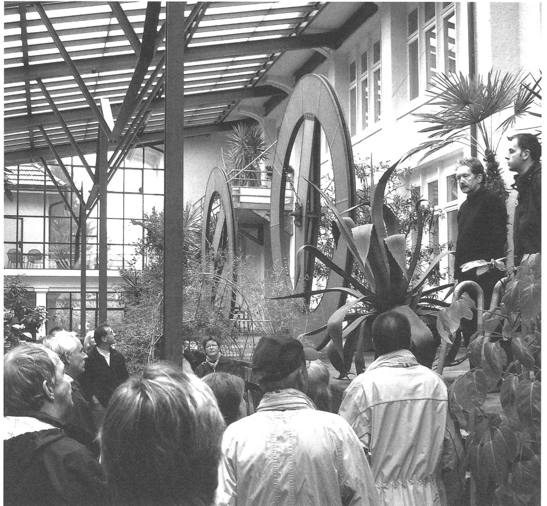
Leben in einer ehemaligen Fabrik: Das Wohnprojekt «Tamerlan» in Tramelan zog zahlreiche Besucherinnen und Besucher in seinen Bann.

In den beiden Basel besuchten über 1100 Interessierte üblicherweise nicht öffentlich zugängliche Privathäuser. Die «Villa Riantmont» in Solothurn wurde beinahe überannt: Über 500 Personen erlebten den eindrücklichen «vorher:nachher»-Effekt der laufenden Restaurierung. Von den rund 3100 Besuchenden im Kanton Bern nutzten fast 1000 Personen die einmalige Chance,