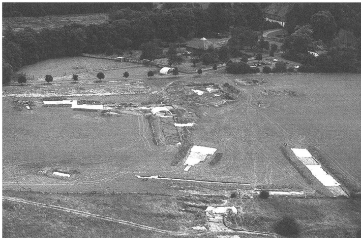
Luftaufnahme (von Westen) der Stadtwüstung Nienover.

Bislang wurden rund 30 von rund 100 ehemals mit Holzschindeln gedeckten Fachwerkhäusern ausgegraben. Sie sind bis zu 25 Meter lang. Auch einige der gepflasterten Strassen, Nebengebäude und Metallwerkstätten wurden freigelegt. Fundamente der Stadtkirche konnten auf dem mehrere tausend Qua-