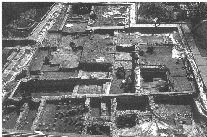
Ein grosser Teil der römischen Luxusvilla mit Säulenhallen und Innenhof ist 2004/2005 entdeckt worden.

Auch die 2004 entdeckte Villa hätte einem Einfamilienhaus weichen müssen. Sie wird nun aber unter Schutz gestellt. Gestützt auf das neue kantonale Archäologiestraatgesetz vom Februar 2003 habe der Baslerbieter Regierungsrat diesen «mutigen Entscheidung» für den Erhalt des Monuments gefällt, so Furger weiter. Das Land soll dem privaten Eigentümer abgekauft, für seinen bislang geleisteten Planungsaufwand soll er angemessen finanziell entschädigt werden.