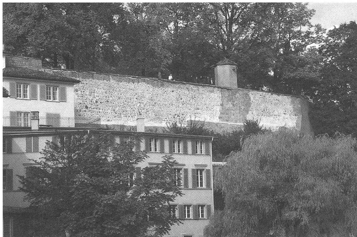
Sanierung abgeschlossen: Die vollständig vom Gerüst befreite Lindenhof-Stützmauer.

Die stadthistorisch bedeutsame Mauer soll künftig nicht mehr von Efeu verdeckt werden. Der Lindenhof, der wie eine antike Zitadelle über dem Fluss thront, tritt nun optisch wieder als wichtiger Körper im Limmatraum in Erscheinung. Im Rahmen des «Plan Lumière» wird die limmatseitige Mauer in der Nacht «sanft» beleuchtet, schreibt die Stadt Zürich in einer Medienmitteilung.