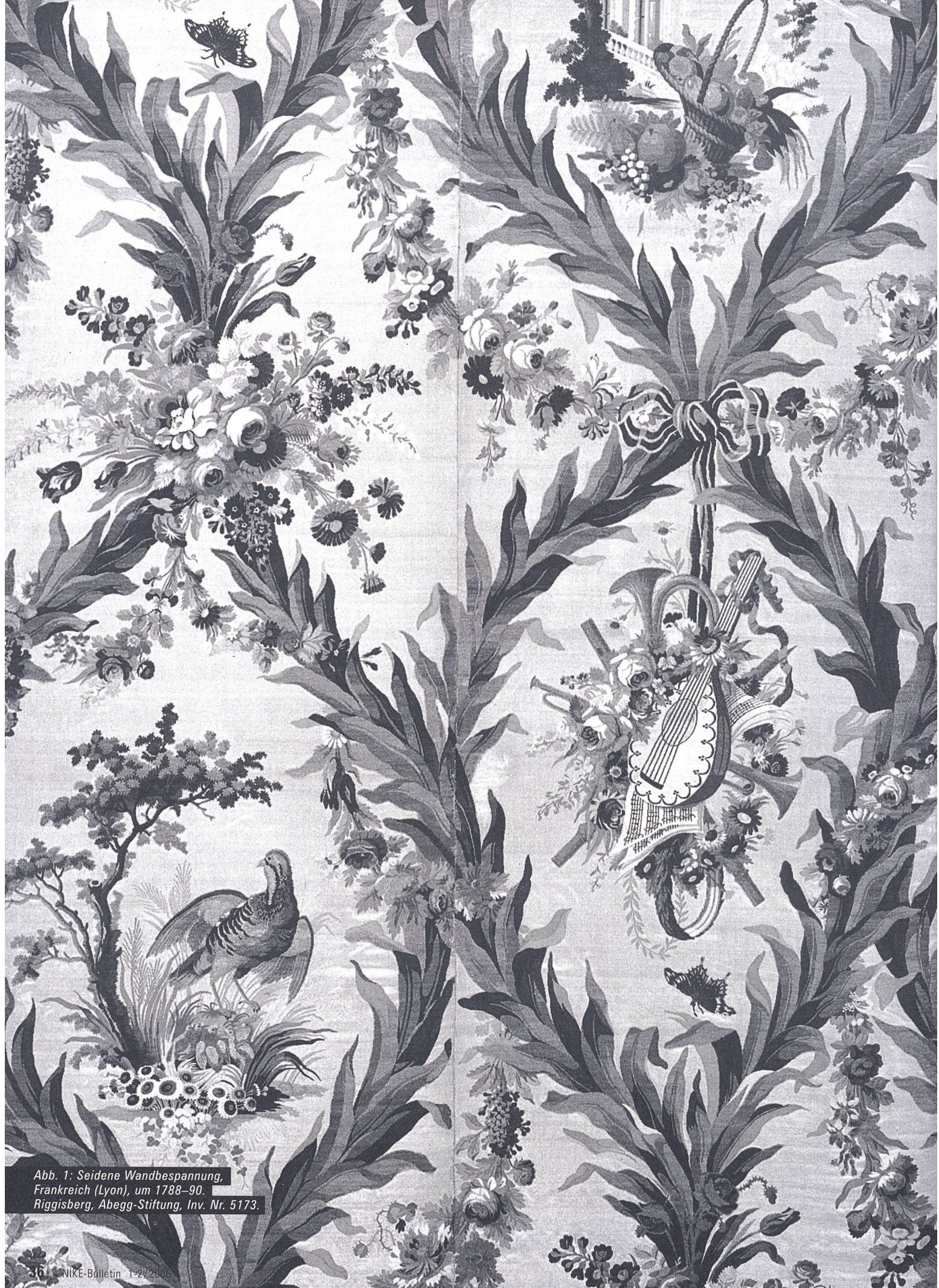
Abb. 1: Seidene Wandbespannung, Frankreich (Lyon), um 1788–90. Riggisberg, Abegg-Stiftung, Inv. Nr. 5173.