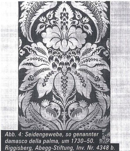
Abb. 4: Seidengewebe, so genannter damasco della palma, um 1730–50. Riggisberg, Abegg-Stiftung, Inv. Nr. 4348 b.

vogue. Dieser Trend spiegelt sich sowohl in den Dekorationsseiden als auch in den Kleidern verarbeiteten Stoffen. Das Muster des so genannten damasco della palma gehört zu den weit verbreiteten Formenfindungen des 18. Jahrhunderts (Abb. 4). Es entstand vermutlich erstmals um 1730 in Italien, wurde in der Folgezeit aber auch in anderen Ländern produziert und ist sogar heute noch bei traditionsreichen französischen Seidenmanufakturen erhältlich. Das zentrale Motiv zeigt eine grosse symmetrische Pflanze mit weit ausladenden Lanzettblättern, einer grossen geöffneten Blüte und rundlichen Fruchtkapseln. Die Blätter und Blütenblätter der Pflanze sind durch gebogene Linien und Verzierungen innerhalb der Konturen plastisch modelliert. Obwohl die in Seide gewebte Pflanze keine bekannte Palmenart darstellt, erhielt sie ihren Namen vermutlich aufgrund ihres grossartigen Blattwerks, das vage an Palmwedel erinnert. Aufgrund des sehr hohen Musterrapports von 124 cm ist anzunehmen, dass der Damast in erster Linie in der Innendekoration Verwendung fand, insbesondere für Wandbespannungen, Sitzmöbelbezüge sowie Bett- und Fenstervorhänge.