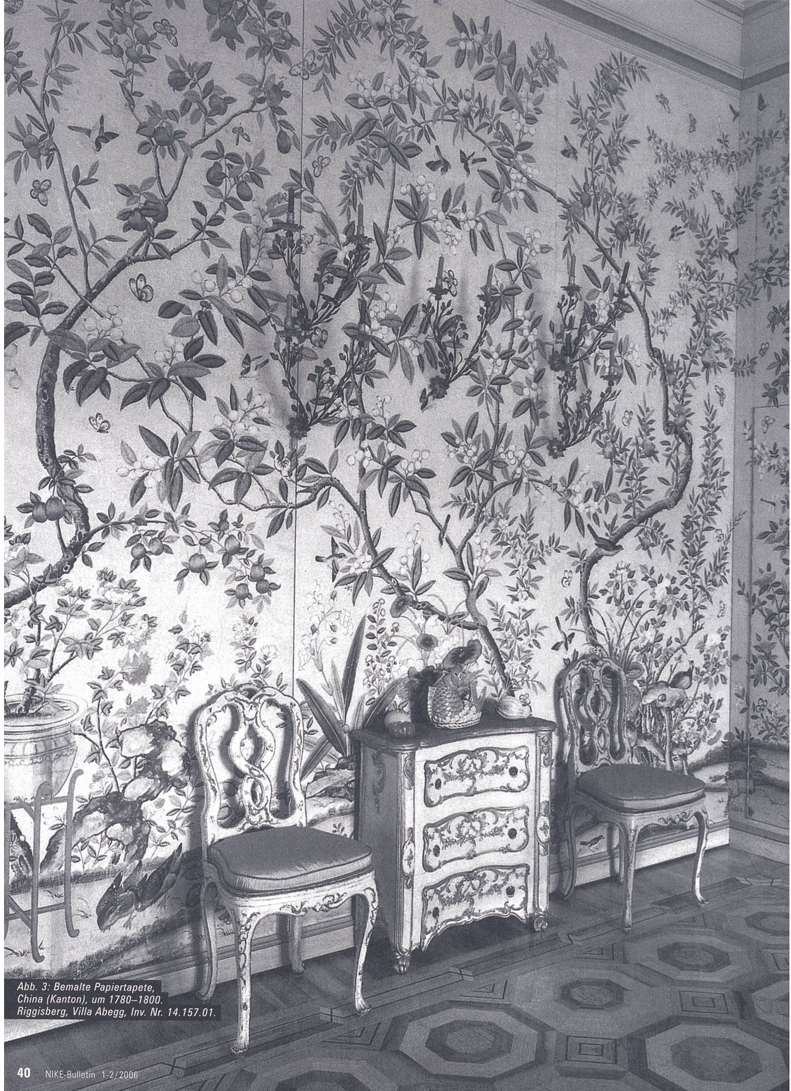
Abb. 3: Bemalte Papiertapete, China (Kanton), um 1780–1800. Riggisberg, Villa Abegg, Inv. Nr. 14.157.01.