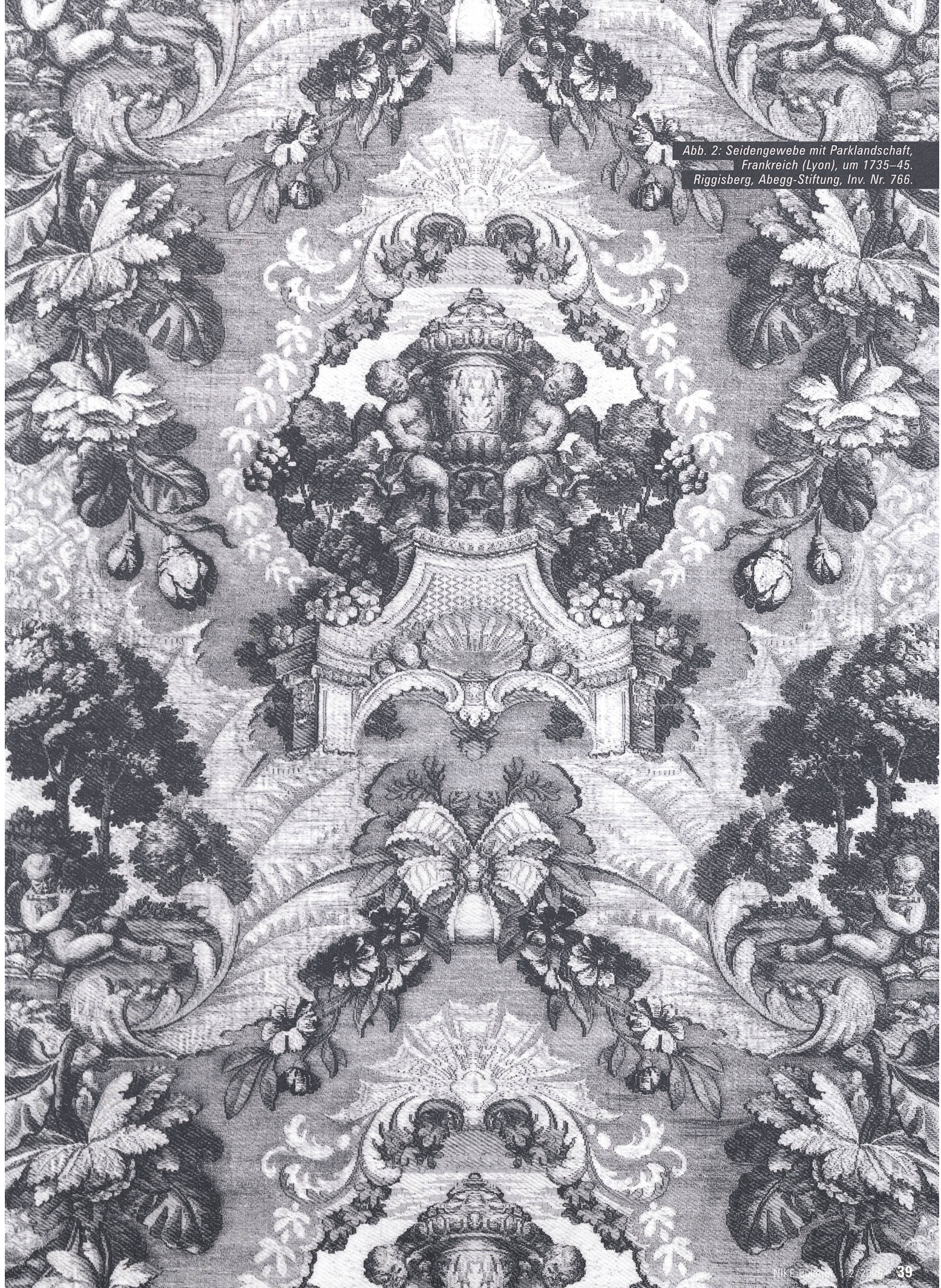
Abb. 2: Seidengewebe mit Parklandschaft, Frankreich (Lyon), um 1735–45, Riggisberg, Abegg-Stiftung, Inv. Nr. 766.