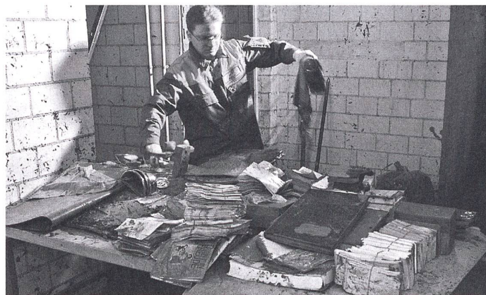
Erfolgreicher Einsatz des KGS-Teams im Kirchgemeindearchiv von Auw AG.