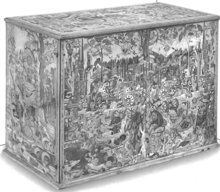
Abb. 2: «Wrangelschrank», Kabinettschrank mit Bildmarketerien und -intarsien, Augsburg (?), Meister der Hausmarke, 1566. Aussenhaut einheimische Harthölzer auf Ahorn und Kiefernholz, teilweise gefärbt, brandgezeichnet und -schattiert.

«Möbel sind aus Holz!»: Eine solche Aussage macht heute niemand mehr in dieser selbstverständlichen Ausschliesslichkeit. Die alte Regel hat ausgedient und sich, überspitzt gesagt, zur gepflegten Ausnahme gewandelt. Sie bezieht sich auf die grosse und lange Geschichte einer handwerklichen Möbelkunst, der durch die Industrialisierung und die geänderten Lebensgewohnheiten nach und nach der Boden entzogen wurde. Parallel zu einem technisch immer raffinierteren und luxuriöseren Kunsthandwerk bediente erstmals im Historismus eine neue Massenproduktion die breiten Volksschichten. Zunächst mit dampfbetriebenen Press- und Biegetechniken sowie zahlreichen Holzimitations- und -ersatzprodukten entwickelte sich später mit unzähligen Kunststoffen und Metalllegierungen eine zwar wohlfeile, aber kurzlebige Massenproduktion, die heute die hintersten Ecken der Welt überflutet.