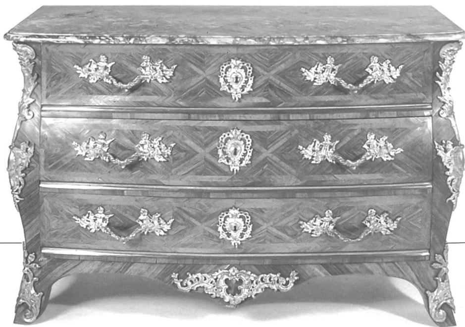
Abb. 3: Prunkkommode, Bern, Mathäus Funk, um 1740. Aussenhaut Palisander und Nussbaummaser auf Nadelholz, feuervergoldete Bronzebeschläge, Deckplatte aus «Marbre de Belp», Schubladen mit Kleisterpapier.

Nördlich der Alpen und damit auch in der Schweiz zierten in der Renaissance überreich gestaltete Marketerie-Gemälde aus einheimischen Harthölzern (Abb. 2), im Früh- und Hochbarock vorgeblendete Architekturordnungen die dahinter befindlichen nüchternen Möbelkuben. Ab dem Spätbarock und bis in das Spätbiedermeier hinein wurden die anspruchsvolleren Kastenmöbel vorwiegend mit ausgesuchten einheimischen Edel-