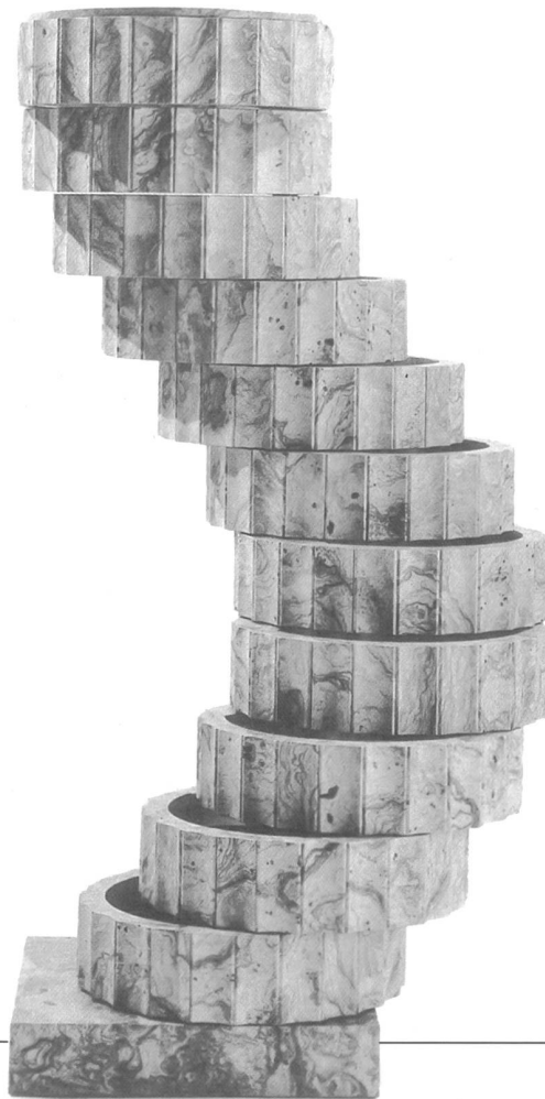
Abb. 7: «Lehrstück II: Störung der Form durch die Funktion», Schubladen- stock, Robert & Trix Haussmann, 1978. Olivenesche furniert.