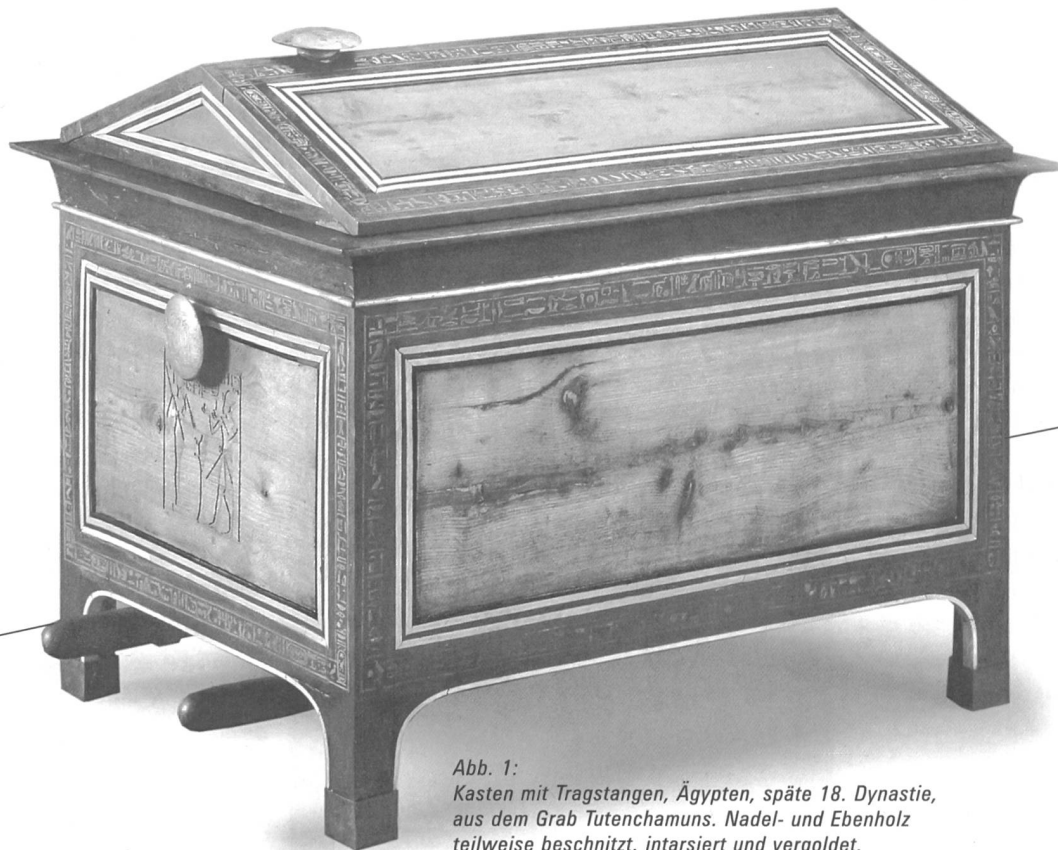
Abb. 1: Kasten mit Tragstangen, Ägypten, späte 18. Dynastie, aus dem Grab Tutenchamuns. Nadel- und Ebenholz teilweise beschnitzt, intarsiiert und vergoldet, Elfenbein, Blattgold, Kupferlegierung, Glaspaste.

Eine reiche Handwerkstradition mit Aussichten