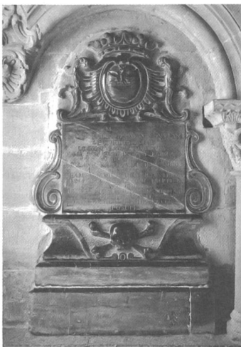
Stèle funéraire de Philippe-Germain de Constant († 1756), œuvre probable de Louis Dupuis.

Le monument d'Othon de Grandson († 1328) se distingue du lot, de par la personnalité du défunt et de par ses qualités architectoniques et stylistiques, révélant des influences françaises et anglaises; cette construction hors sol, démonstration de puissance, anticipe en quelque sorte d'une cinquantaine d'année deux monuments caractéristiques de la politique funéraire de la haute noblesse (La Sarraz, Neuchâtel).