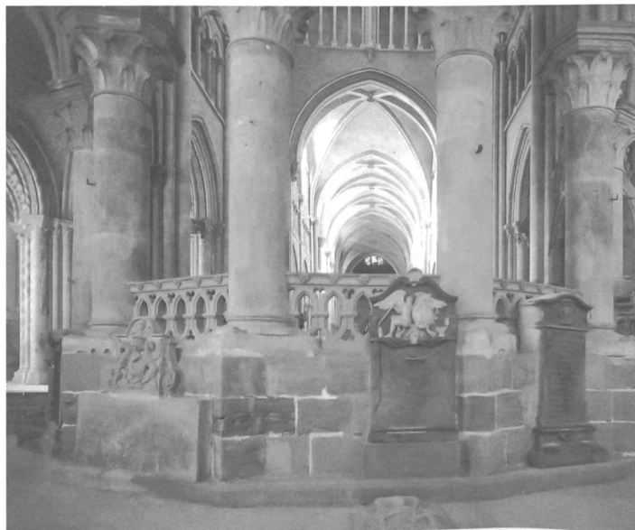
La cathédrale vue du déambulatoire, avec les monuments funéraires au premier plan, vers 1900.

Le découpage de l'ouvrage reflète ces diverses approches. Si le catalogue richement illustré des pièces conservées en constitue l'épine dorsale, plusieurs articles thématiques et monographiques mettent en évidence le rôle de la cathédrale comme lieu privilégié et réservé de sépulture, les vicissitudes auxquelles ce patrimoine a été soumis; ils analysent le mobilier funéraire retrouvé dans les tombes et, par le jeu des comparaisons stylistiques, la place de ces pièces dans l'histoire de l'art tant régionale que générale. Enfin, le catalogue des trouvailles monétaires, bien que rarement associées à une tombe de manière expli-