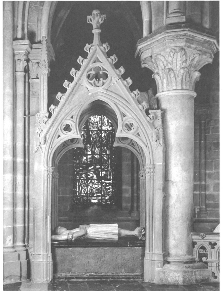
Monument d'Othon de Grandson († 1328), face sud.

Bien que les autorités bernoises aient interdit les inhumations dans les temples (1529), cette pratique reprend dès la fin du XVI e siècle. A Lausanne, les premiers monuments d'après la Réforme datent des années 1630; ils sont d'abord très simples (dalles) et ne donnent que le nom du défunt, sa fonction et ses armoiries. Un premier édicule adossé à la paroi apparaît en 1652, érigé pour Barbara Widenbach, belle-mère du bailli de Lausanne. Cette mode du monument «debout» ira en parallèle avec celle, plus traditionnelle, de la dalle au sol qui persiste jusqu'à la fin du XVIII e siècle. Elle donne à la cathédrale de beaux ouvrages d'esprit baroque, voire rococo, fréquemment traités dans du marbre noir de Saint-Triphon. Une série a pu être attribuée au sculpteur d'origine parisienne Louis Dupuis, actif à Lausanne dans les années 1750–1760; avec lui apparaissent des motifs iconographiques évoquant soit la mort et le passage du temps (crânes, tibias, cadrans d'horloge), soit la carrière des défunts: le monument de Samuel Constant de Rebecque (1756) est caractéristique à cet égard, portant tout un attirail militaire (tambours, drapeaux, canons) rappelant la brillante carrière de cet officier au service de la Hollande et mort au champ de bataille. Le monument