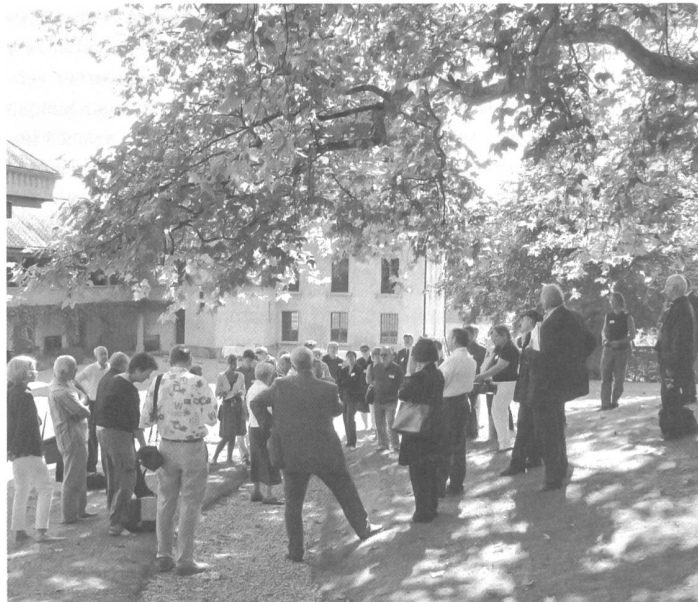
Ein rundum gelungener Anlass: Die Lancierung des Denkmaltages im Schlosspark von Barberêche.

Die Vorbereitungen liefen ab dem Frühjahr. Mit Lignum, dem Verband der Schweizer Schreinermeister und Möbelfabrikanten VSSM und dem Bund Schweizer Architekten BSA