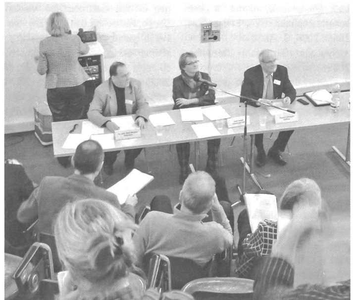
Die 18. ordentliche Delegiertenversammlung fand am 16. März 2006 im Vortragsaal der Stadt- und Universitätsbibliothek Bern statt.

«Europäischer Tag des Denkmals/ Journées européennes du patrimoine/ Giornate europee del Patrimonio» Offizielle gesamtschweizerische Broschüre zum Denkmaltag unter dem diesjährigen Slogan «Gartenräume – Gartenträume/Les jardins, cultures et poésie/Giardini tra sogno e realtà» vom 9./10. September 2006, gemischt dreisprachig deutsch, französisch und italienisch, Bern 2006, 84 S., ill., Auflage 63 000 Exemplare.