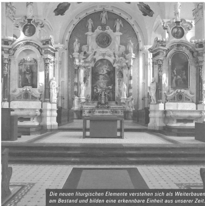
Die neuen liturgischen Elemente verstehen sich als Weiterbauen am Bestand und bilden eine erkennbare Einheit aus unserer Zeit.