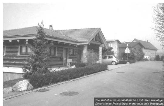
Die Wohnbauten in Rundholz sind mit ihren wuchtigen Dimensionen Fremdkörper in der gebauten Umgebung.

Infos im Internet: www.fondationaubert.ch