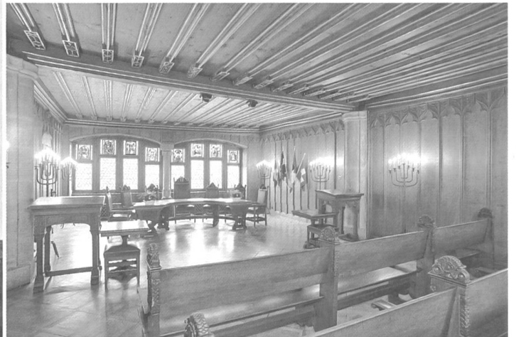
3) Der Tagsatzungsraum im Badener Stadthaus.

W o öffentliches Leben organisiert werden muss, braucht es Gebäude mit Räumlichkeiten, in denen die verschiedensten Angelegenheiten und Geschäfte beraten und die damit verbundenen Arbeiten erledigt werden können. Diese Gebäude geben mittels ihrer Grösse, ihrer architektonischen Umsetzung und stilistischen Ausgestaltung, ihrer inneren Organisation, ihres Schmuckes, der Art und Ausstattung ihrer Räumlichkeiten die politischen Wurzeln, das Selbstverständnis, den Organisationsgrad und die Differenziertheit des regierten Staatsgebildes preis.