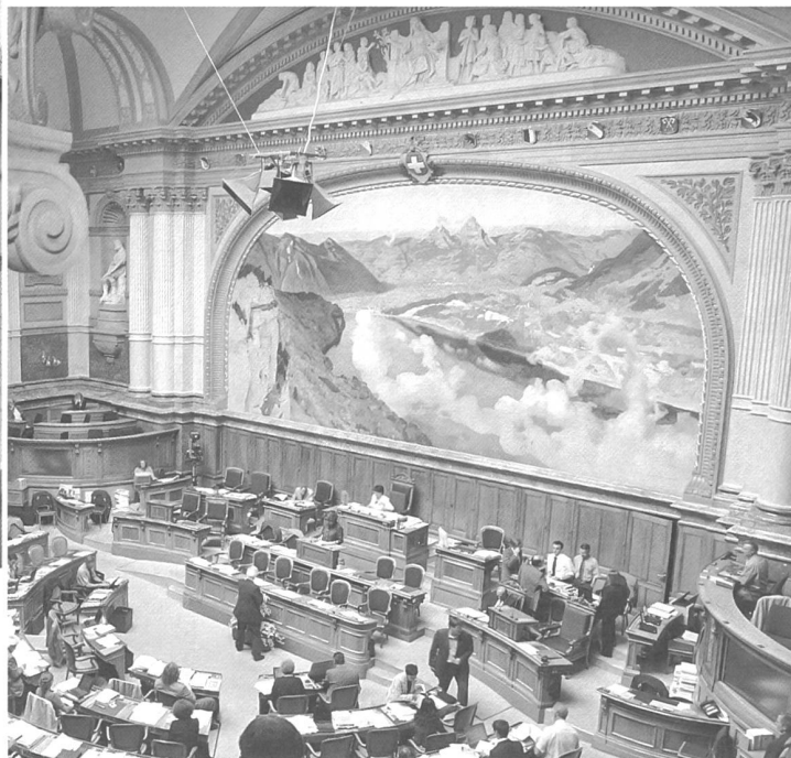
5) Der Nationalratssaal.

In Lausanne wurden der Bischofspalast und der Berner Vogteisitz mit der Kantonsregierung belegt und zwischen 1803 und 1806 am Ort der «Cour du Chapitre» das Grossratsgebäude errichtet. Viele Binnenstrukturen des alten Hauses blieben neben dem neu eingerichteten grossen Parlamentssaal erhalten, dem die Bänke für die Volksvertreter im Halbrund eingeschrieben sind. Die eingeschossige Hausteinfassade mit zentralem Drillingsportal am Schlossplatz, bestehend aus zwei Flügeln und einem Mittelrisalit – vier toskanische Säulen tragen Gebälk und Dreiecksgiebel –, wurde alsbald zur Chiffre für die erlangte kantonale Selbstständigkeit.