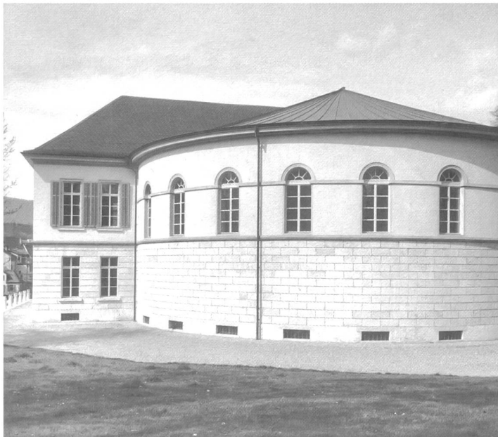
4) Das Grossratsgebäude in Aarau.