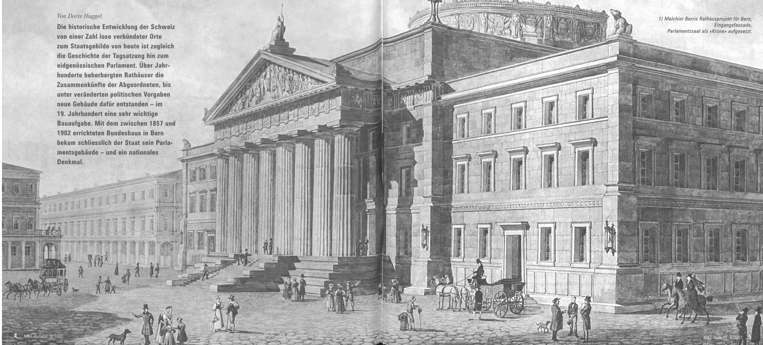
1) Melchior Berris Rathausprojekt für Bern, Eingangsfassade, Parlamentsaal als «Krone» aufgesetzt.

Die historische Entwicklung der Schweiz von einer Zahl lose verbündeter Orte zum Staatsgebilde von heute ist zugleich die Geschichte der Tagsatzung hin zum eidgenössischen Parlament. Über Jahrhunderte beherbergten Rathäuser die Zusammenkünfte der Abgeordneten, bis unter veränderten politischen Vorgaben neue Gebäude dafür entstanden – im 19. Jahrhundert eine sehr wichtige Bauaufgabe. Mit dem zwischen 1857 und 1902 errichteten Bundeshaus in Bern bekam schliesslich der Staat sein Parlamentsgebäude – und ein nationales Denkmal.