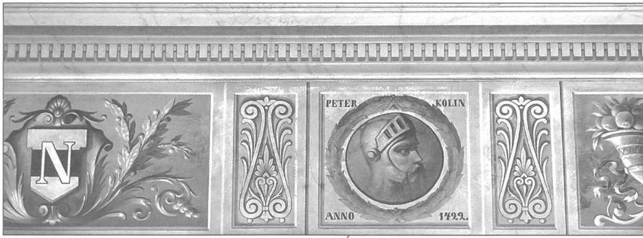
4) Ein Ausschnitt der Dekorationsmalerei an der Wand.