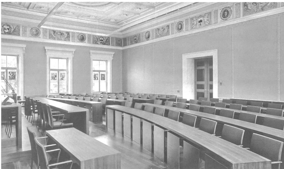
6) Alt und neu: Der renovierte Kantonsratssaal hat seine Ambiance bewahrt.