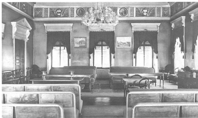
2) Gegenüber: Die alte Sitzanordnung vor 1938.