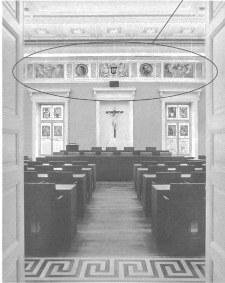
5) Der Saal vom Eingang her gesehen: Die neue Möblierung und der neue Boden werden vom Mäandermuster des alten Bodenrandfrieses gerahmt.