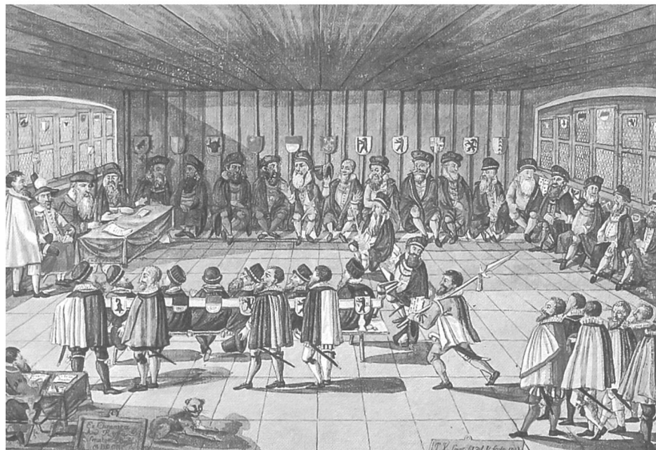
2) Anonyme (Hieronymus Vischer?), Aquarelle tirée d'Andreas Ryff, «Zirkel der Eidgenossenschaft», 1597; 19.4 x 29.5 cm.