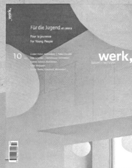
10|07 Für die Jugend et cetera