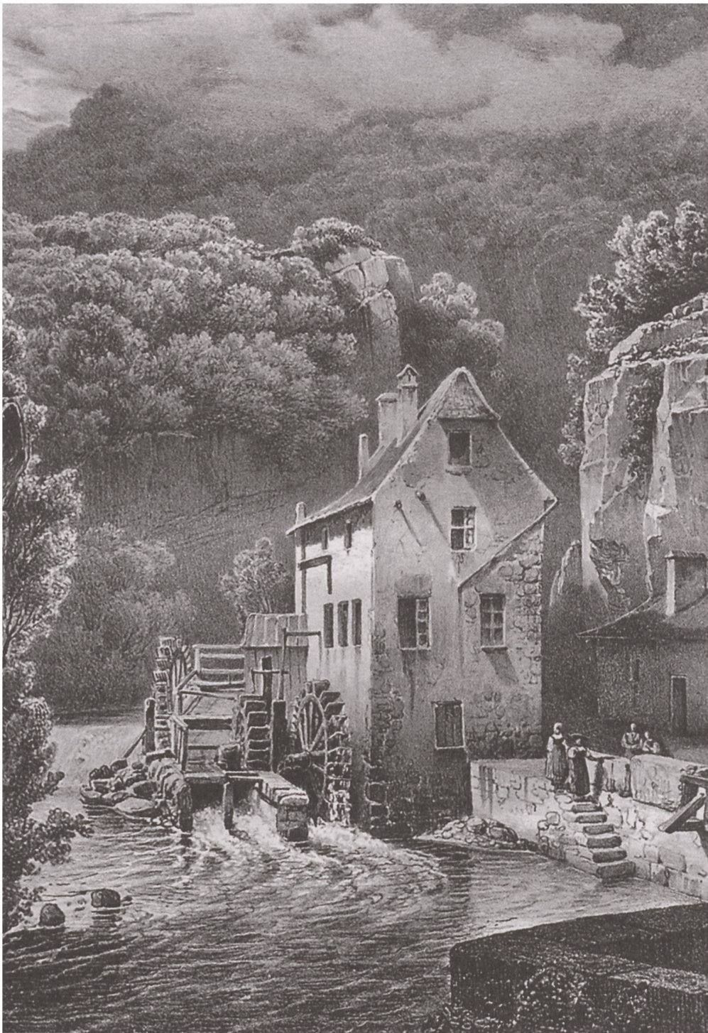
Saint-Imier, le canal de la Suze et la fabrique des Longines vers 1910.

troi d'une lettre de fief par le souverain, le prince-évêque. Vers 1760, le bassin erguëlien de la Suze compte 33 sites hydrauliques, soit une centaine de roues actionnant 120 engins. Le moulage des grains l'emporte nettement, suivi d'assez loin par les activités des battoirs 1 et des scieries. Ces secteurs traditionnels représentent alors plus des trois quarts des applications de l'énergie hydraulique. Comme le moulin rural pourvoit alors aux besoins de la communauté locale, la densité des sites est fonction de la population et non des conditions hydrographiques. Dès les années 1760, l'Erguël vit une crise de la meunerie qui débouchera sur une concentration de la propriété et l'abandon des installations les moins rentables. Cette crise ne sera cependant guère accompagnée d'une véritable mutation des modes d'exploitation.