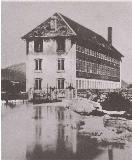
Saint-Imier, la fabrique des Longines vers 1880.