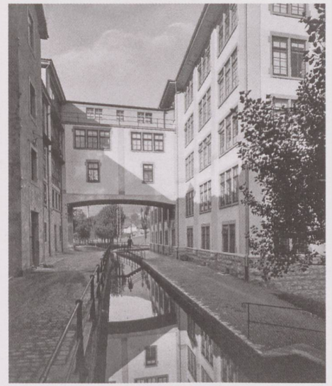
Saint-Imier, le canal de la Suze et la fabrique des Longines vers 1910.

foulons et teintureriers sur la Suze déclineront inexorablement, au point de disparaître bientôt complètement.