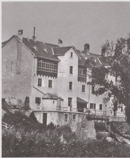
La fabrique de montres Cortébert-Watch vers 1900.