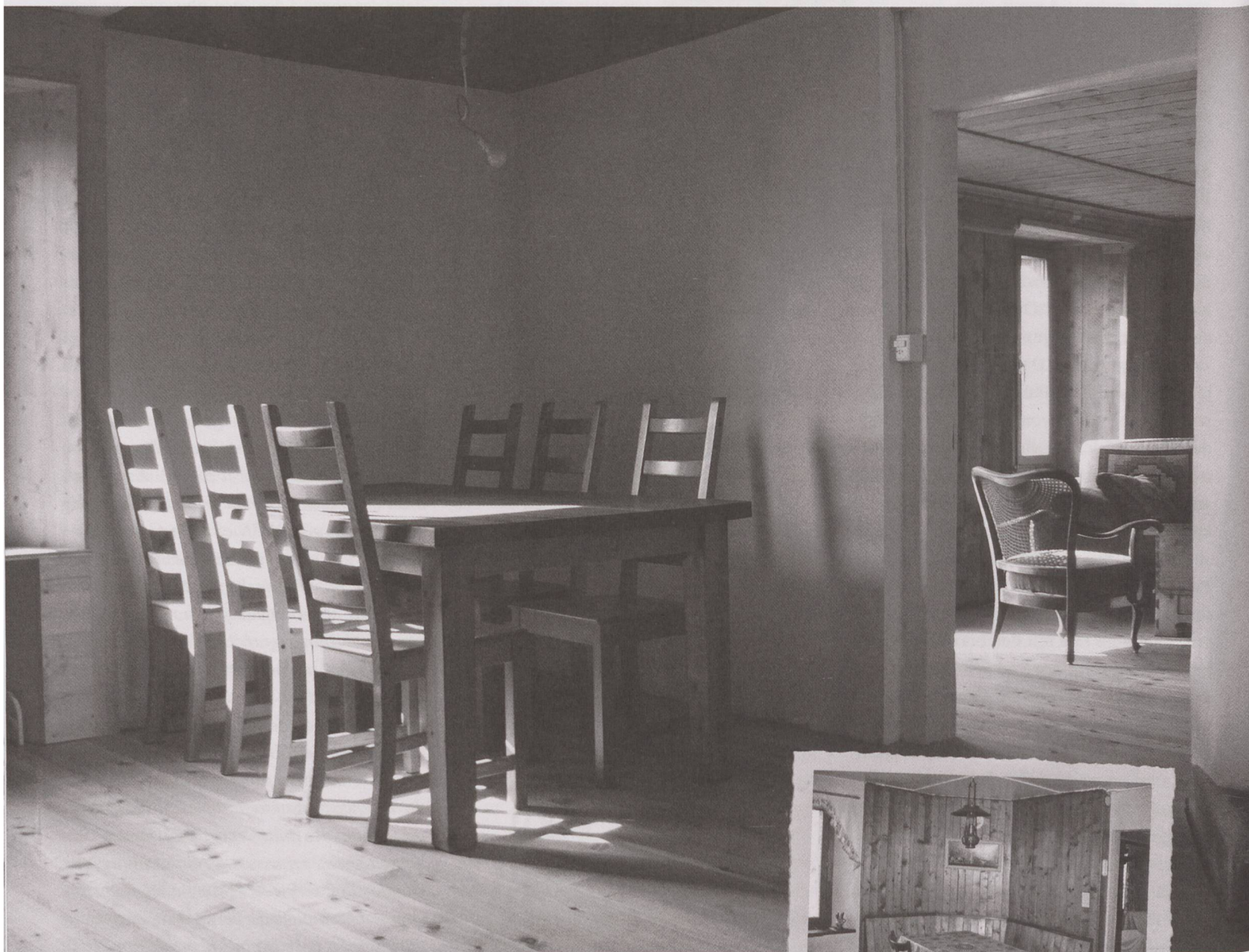
Vue sur la cuisine avant – après.

Contribution à une théorie pour l'assainissement énergétique du patrimoine bâti