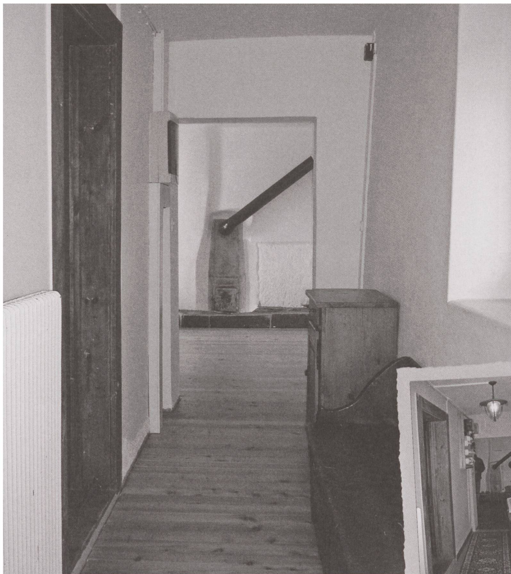
Vue sur le couloir d'entrée avant – après.