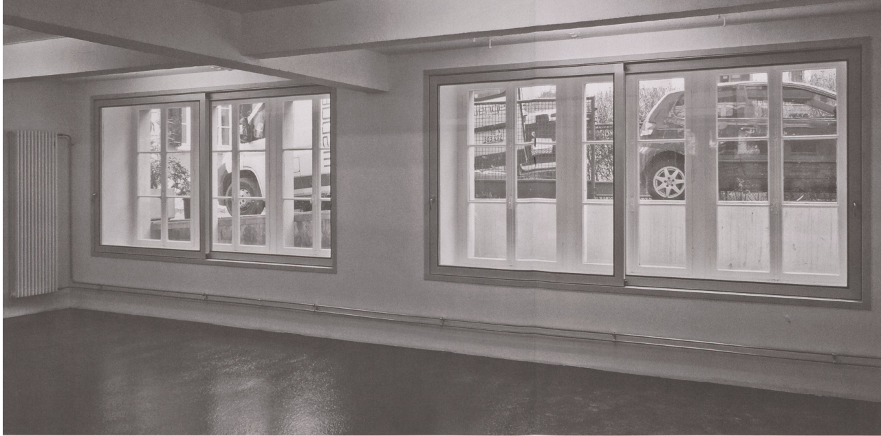
Biel: Neue, dreifachverglaste Schiebefenster ermöglichen den Erhalt der originalen, einfachverglasten Fenster.