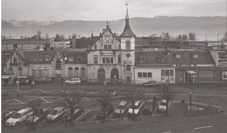
Der Bahnhof Rapperswil vor...