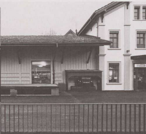
Umbau des Aufnahmegebäudes und des Güterschuppens in Goldach SG in ein Ladengeschäft 2008: Das historische Stellwerk wird als Erinnerung belassen.