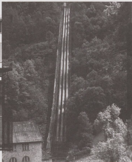
Die Druckleitungen von Amsteg UR gelten als Teil eines Ensembles von Nationaler Bedeutung. Sie sind heute allerdings nicht mehr in Betrieb.

Trockenmauern oder technische Denkmale wie Drehscheiben, Stellwerke etc. Die Objekte müssen einen signifikanten eisenbahnhistorischen Zeugniswert besitzen oder entsprechender Teil einer Strecke oder eines ortsbaulichen Ensembles sein.