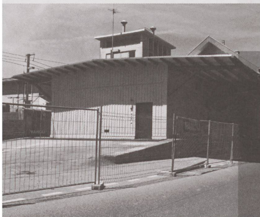
Der Güterschuppen von Steinhausen ZG wurde erhalten und für 2009 die Bahntechnik umgenutzt (Einbau einer elektronischen Stellwerkanlage).

veraltet. Viele Gebäude sind nicht, Brücken und andere Ingenieurbauten erst in den wenigsten Fällen erfasst. Trotz dieses Inventars ist in den 80er- und 90er-Jahren des 20. Jahrhunderts einiges verschwunden, weshalb in zahlreichen Fällen eine Aufstufung in einen höheren Schutzgrad des noch vorhandenen Bestandes angezeigt ist. Gemäss aktuellen Bedürfnissen (etwa ausgelöst durch Projekte in Knotenpunkten oder entlang von Strecken) werden nach Fachbereichen getrennt laufend Aktualisierungen oder Ergänzungen erarbeitet. Dazu gehören Übersichten über Kantone, Linien, Ensembles oder besondere Bestände, wie etwa auch ein Inventar über alle noch vorhandenen Drehscheiben im SBB-Netz.