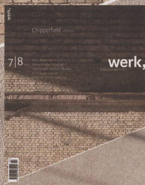
7-8|09 Chipperfield et cetera