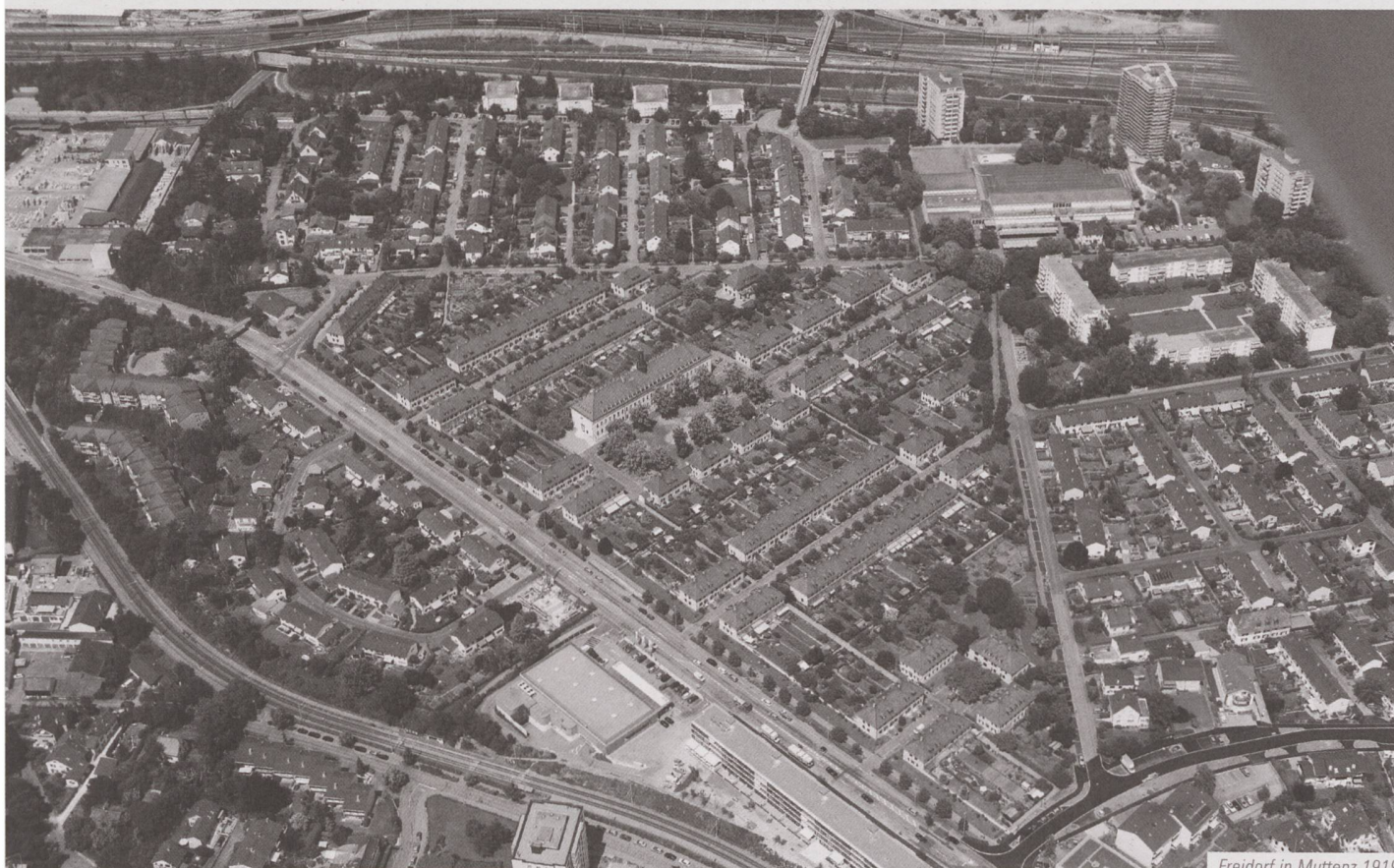
Freidorf in Muttenz 1919