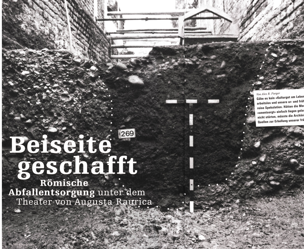
Wie eine dunkle Tasche, vollgeschüttet mit Erde, Kieseln und Scherben, gibt sich der mit Abfall gefüllte Graben auf der Ausgrabung im Erdprofil zu erkennen (weisse Punktlinie).

Von Alex R. Furger Gäbe es kein «Kulturgut am Lebensweg», wären die Archäologen arbeitslos und unsere ur- und frühgeschichtliche Vergangenheit reine Spekulation. Hätten die Menschen nicht Abfälle produziert und «unentsorgt» einfach liegen gelassen, wo sie anfielen und offenbar nicht störten, müsste die Archäologie auf ihre häufigsten materiellen Quellen zur Erhellung unserer frühen Geschichte verzichten.