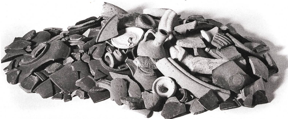
Dies ist einer von zwanzig «Fundkomplexen», die innert kürzester Zeit als Kehricht im offenen Graben im Augster Theater entsorgt worden sind.

Le fait que cette fosse n'ait contenu que des matériaux sans valeur a ainsi permis aux archéologues de conclure qu'il s'agissait d'un petit dépôt d'ordures et de gravats, qu'ils ont ensuite pu dater du II e siècle de notre ère. La proportion des divers matériaux retrouvés indique que la décharge recueillait probablement des déchets ménagers (fragments de récipients en céramique) et des matières organiques (restes d'os, de bois, de plantes, etc.), mélangés à de la terre.