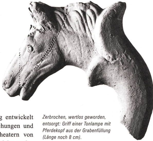
Zerbrochen, wertlos geworden, entsorgt: Griff einer Tonlampe mit Pferdekopf aus der Grabenfüllung (Länge noch 8 cm).

Die archäologische Forschung entwickelt sich laufend. Auch die Forschungen und Erkenntnisse zu den drei Theatern von Augusta Raurica sind noch nicht restlos ausgewertet und gesichert. Wie oben dargestellt, haben die Archäologen noch ein chronologisches Problem zu lösen: Die zeitliche Abfolge von zweitem Theaterbau, Entstehung der Abfälle, «Planungsleiche» Nord-Graben, Grabenverfüllung und Bau des dritten Theaters.