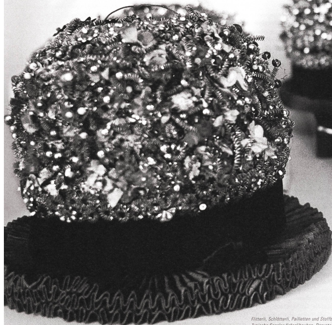
Flitterli, Schlötteri, Pailletten und Stoffblümchen: Typische Sensler Kränzlihauben. Darunter erkennt man die Halskrausen, welche ebenfalls zur Tracht gehören.