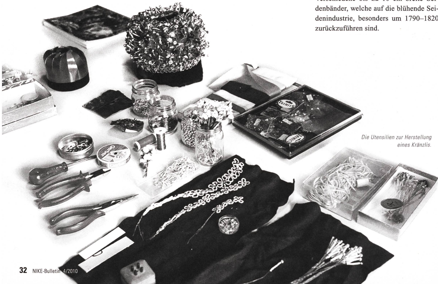
Die Utensilien zur Herstellung eines Kränzlis.