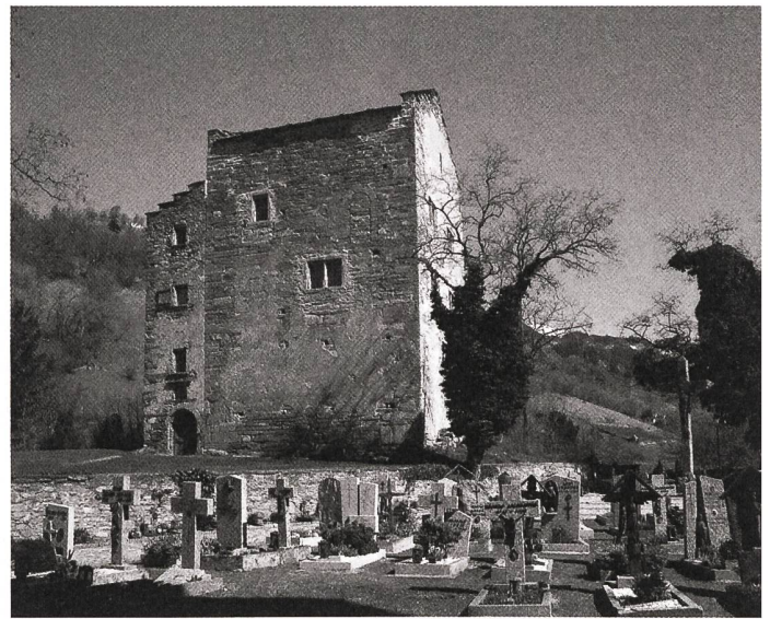
Das Zehndenrathaus in Raron VS.

Gesetzes wegen zugewiesenen Gutachterfunktion haben sie sich auch zum vorliegenden Fall in einem unabhängigen Fachgutachten geäußert. Erwähnenswert ist dieses Gutachten, weil es – entgegen der Auffassung der kantonalen Denkmalpflege – das aus einem nach SIA-Ordnung durchgeführten Wettbewerbsverfahren hervorgegangene Bauprojekt in der vorliegenden Form ablehnt und zur Überarbeitung empfiehlt. Dies erfolgte gestützt auf den Augenschein und eigene Analysen der Kommissionen sowie aufgrund der klaren Vorgaben des ISOS, das der ganzen Altstadt sowohl in der Kategorie der räumlichen wie in der Kategorie der architekturhistorischen Qualitäten die höchste Bewertung zuspricht. Es empfiehlt sich deshalb, im Vorfeld der Formulierung von Wettbewerbsvorgaben die gültigen Rechtsgrundlagen und Fachgrundsätze zu berücksichtigen und diese ins Pflichtenheft einfließen zu lassen. Dadurch kann