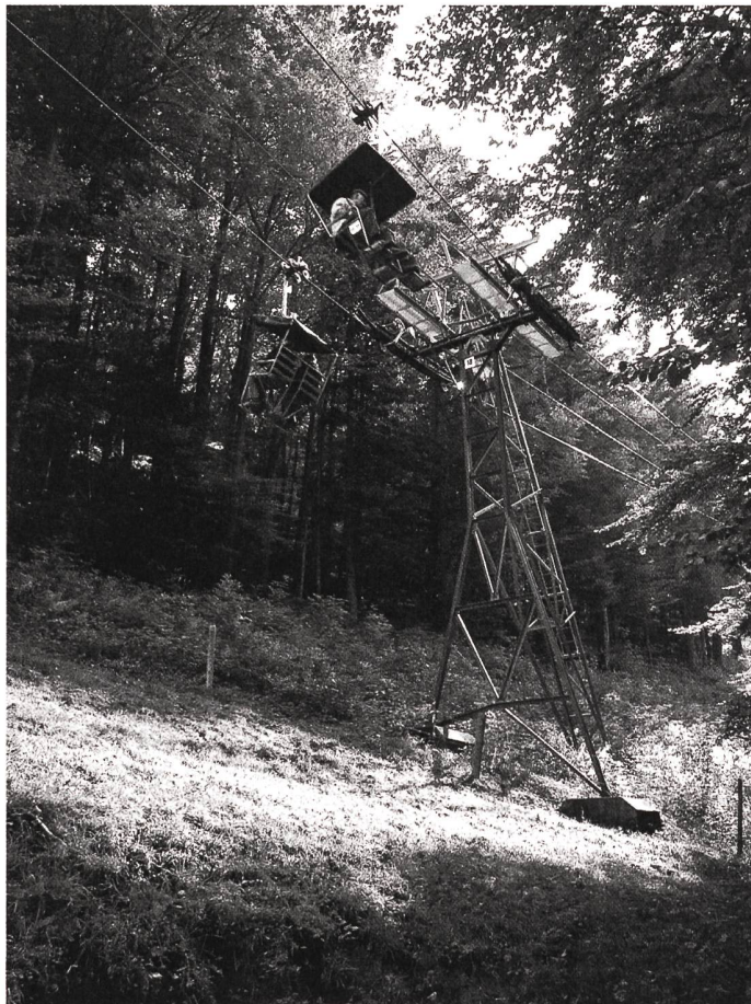
Die Sesselbahn Weissenstein, Oberdorf SO.

Inventar der schützenswerten Ortsbilder der Schweiz ISOS: Ende 2009 ging die Leitung und Koordination des ISOS von Sibylle Heusser auf Marcia Haldemann im BAK über. Den Zuschlag für die fachtechnische Erstellung des ISOS erhielt das Büro inventare.ch GmbH. Das