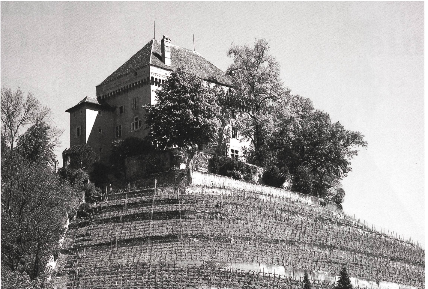
...Château du Châtelard in Clarens...

sation du public à laquelle est parvenue la campagne du Conseil de l'Europe, cette idée doit aussi être nourrie par des concepts théoriques et par des actions de coopération concrètes sur le terrain. Car cet héritage constitue l'un des principaux atouts de l'Europe, non seulement comme témoignage de la richesse de son histoire, mais aussi et surtout comme reflet de sa capacité à créer, reflet du génie et du talent de ses artisans, de ses artistes, de ses créateurs, qui ont toujours su ignorer les frontières, qui ont toujours considéré la culture comme un échange.»