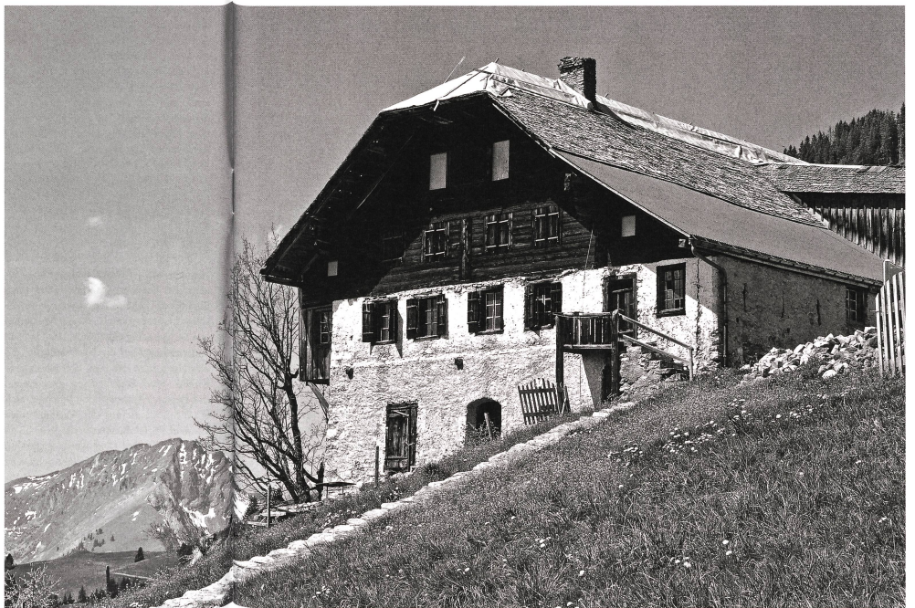
...Châlet in Rossinière...

Ab 2012 soll die Finanzierung von Heimatschutz und Denkmalpflege in einem Schwerpunktprogramm zur Kulturförde-