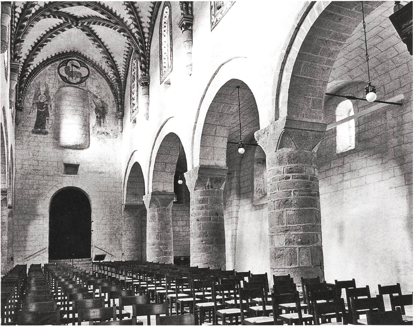
...und Inneres der Kirche von Romainmôtier.

rung erfolgen. Am 25. August hat das Eidgenössische Departement des Innern EDI die Anhörung der «Botschaft zur Kulturförderung für die Jahre 2012–2015» eröffnet. Diese sogenannte Kulturbotschaft legt die Ziele, Massnahmen und Kredite für alle kulturellen Institutionen des Bundes fest. Die interessierten Kreise wurden eingeladen, bis zum 24. November 2010 Stellung zum Entwurf der Kulturbotschaft zu nehmen. Danach wird die Botschaft überarbeitet und im Februar 2011 dem Bundesrat zur Genehmigung unterbreitet. Im Verlauf des Jahres soll sie dann vom Parlament beraten und Ende 2011 von den Räten verabschiedet werden. Am 1. Januar 2012 treten die Botschaft und das Kulturförderungsgesetz in Kraft.