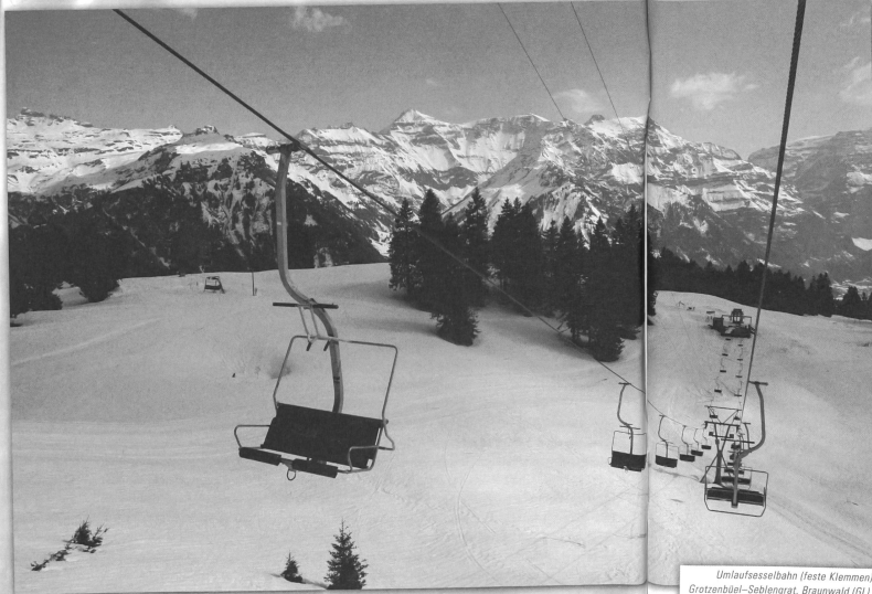
Umlaufseilbahn (Feste Klemmen) Grotzenbüel-Seblengrat, Braunwald (GL), von Streiff (1969).