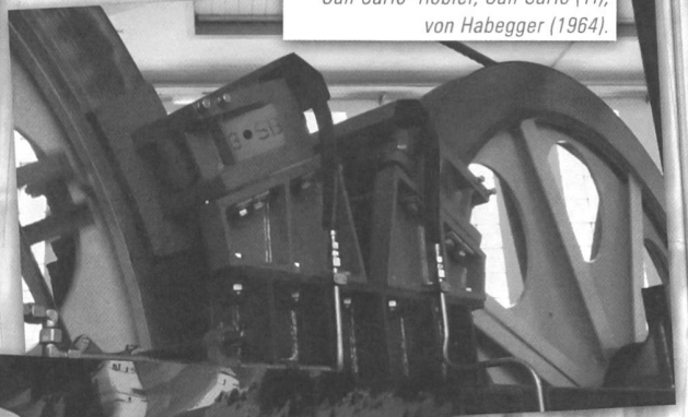
Sicherheitsbremse der Pandelbahn San Carlo-Robiei, San Carlo (TI), von Habegger (1964).