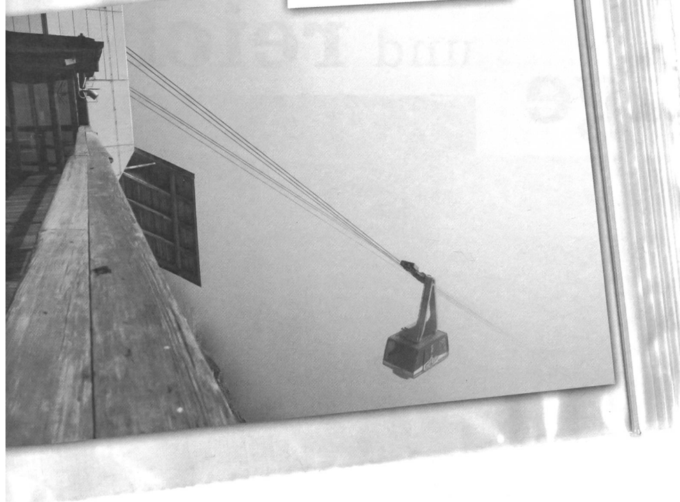
Pendelbahn Mürren-Birg, Mürren (BE), von Von Roll (1965).

zung von Kabinen. An der Unversehrtheit bemisst sich die Ganzheit und Intaktheit des Kulturguts und seiner spezifischen Merkmale, d.h. seine Integrität. Alle wesentlichen Komponenten, die zur Bedeutung der Installation beitragen, müssen umfassend abgebildet sein. Authentizität und Unversehrtheit werden im Kriterien- und Bewertungskatalog mittels der Kategorie Authentizität: materielle und ideelle Überlieferung dargestellt.