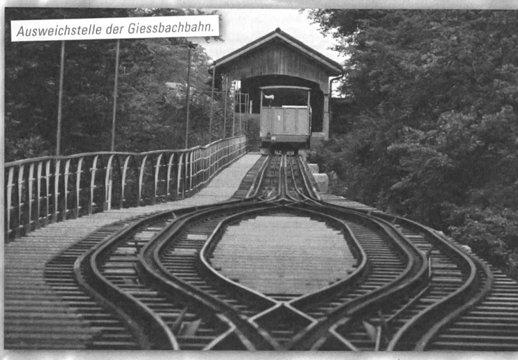
Ausweichstelle der Giessbachbahn.