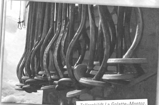
Tellerskilift La Golatte-Montoz, Tavannes (BE), von Poma (1957).