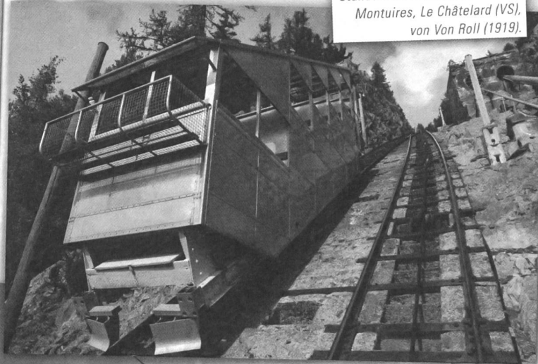
Standseilbahn Le Châtelard–Les Montuires, Le Châtelard (VS), von Von Roll (1919).