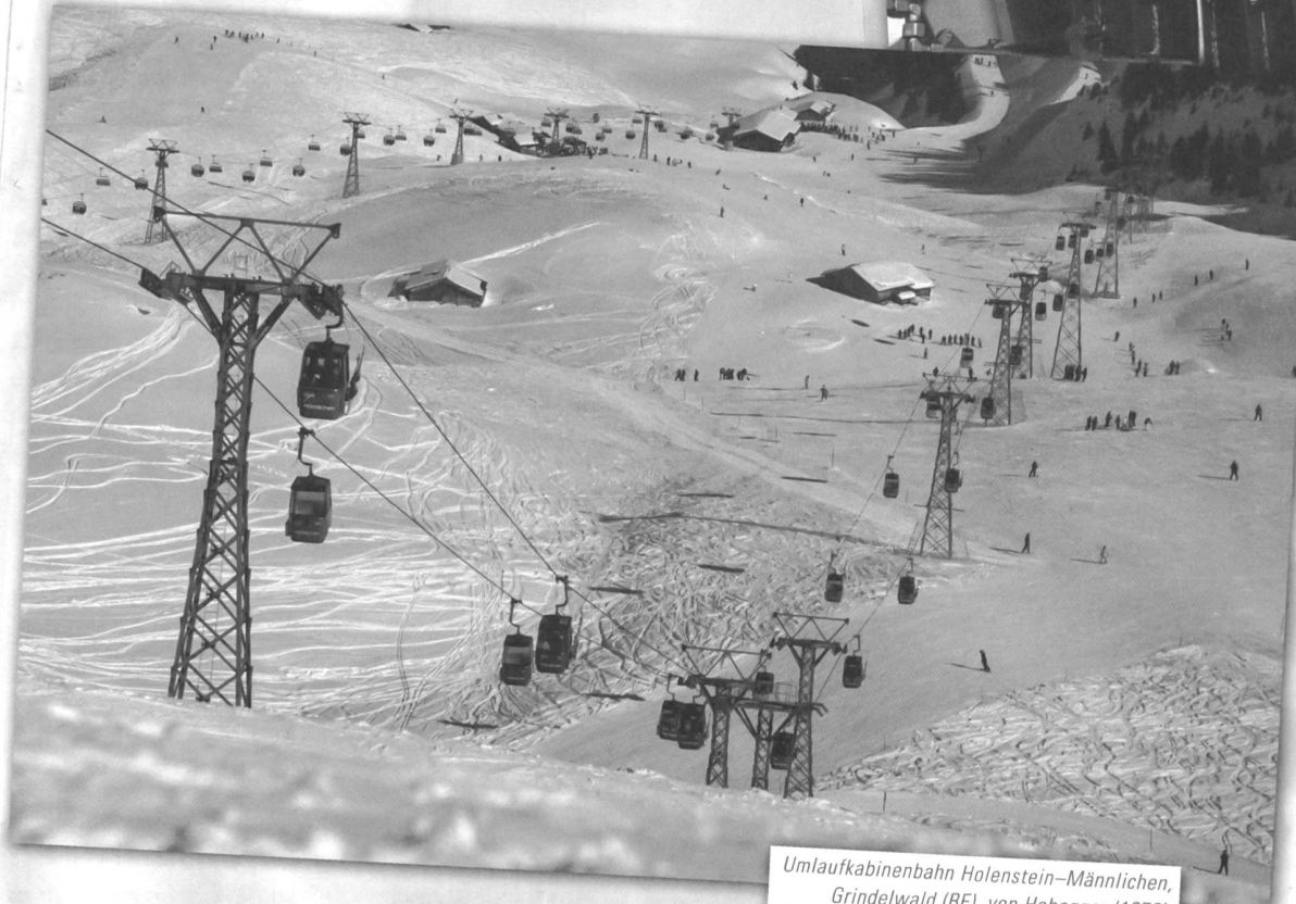
Umlaufkabinenbahn Hohenstein-Männlichen, Grindelwald (BE), von Habegger (1978).

hang mit Baudenkmalern vornehmlich auf die Originalität, d.h. auf die ursprüngliche, möglichst vollständig überlieferte Materie mit all ihren Zeitspuren. Seilbahnanlagen sind jedoch dynamische technische Systeme. Um ihre Funktion erfüllen zu können, müssen sich technische Einrichtungen laufend neuen Erfordernissen stellen; kontinuierliche Anpassungen sind daher unabdingbar. Die Authentizität eines sich