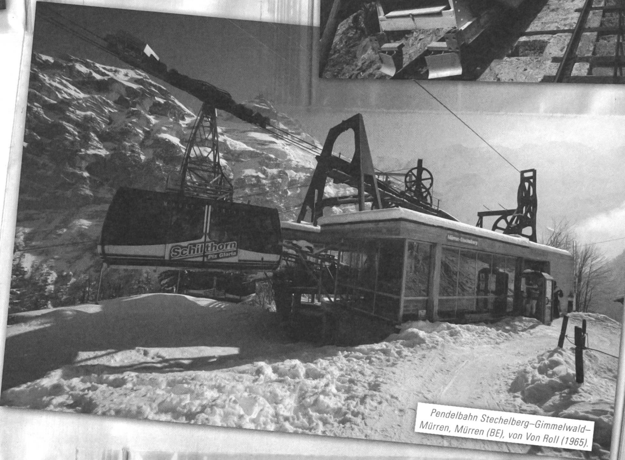
Pendelbahn Stechelberg–Gimmelwald– Mürren, Mürren (BE), von Von Roll (1965).