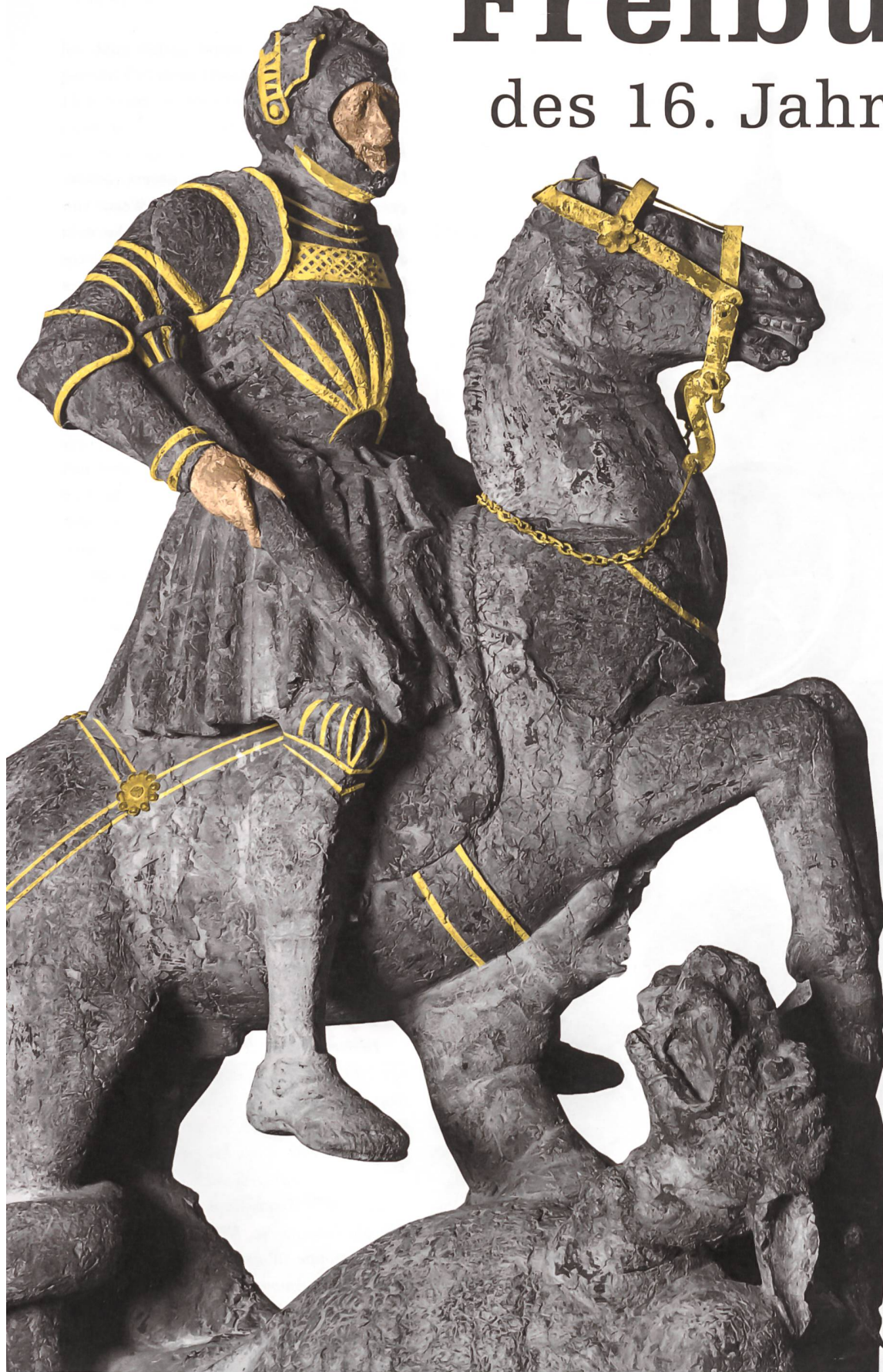
Abb. 1. Werkstatt Hans Geiler: Georgsbrunnen (Rekonstruktion der ursprünglichen Farbigeit), 1524/25. Museum für Kunst und Geschichte Freiburg.