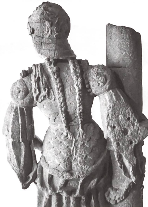
Abb. 5. Werkstatt Hans Gieng: Fortitudobrunnen (Detail), 1549/50. Museum für Kunst und Geschichte Freiburg.

Bei den Bildwerken aus Kalkstein handelt es sich fast ausschliesslich um solche, die frei standen und dauerhaft Wind und Wetter ausgesetzt waren. Zum Schutz wurden solche Werke vollflächig und dick mit bindemittelreichen, fetten Beschichtungen versehen. Man tränkte sie zuerst mit Öl (v.a. Nussöl), bevor man sie mit Ölfarben fasste und mit einem Schutzüberzug versah. Die Fassung solcher Werke musste regelmässig überholt werden. Die Brunnenfiguren in Bern und Freiburg etwa wurden bereits wenige Jahrzehnte nach ihrer Entstehung ein erstes Mal neu gefasst, eine Form des Unterhalts, die in Bern noch heute üblich ist.