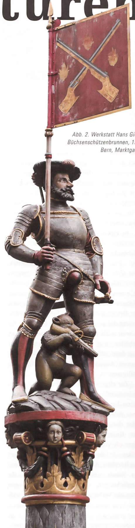
Abb. 2. Werkstatt Hans Gieng. Büchschützenbrunnen, 1543. Bern, Marktgasse.

Daneben wurde in Freiburg auch Kalkstein aus weiter entfernten Steinbrüchen verwendet, der sich wegen seiner höheren Witterungsbeständigkeit vor allem für freistehende Anlagen wie Brunnen eignete. Die Quellen berichten regelmässig von Stein- oder Bildhauern, die im Namen der Auftraggeber das Rohmaterial in auswärtigen Steinbrüchen aussuchten. Für Brunnenbecken verwendete man oft Muschelkalk aus dem Steinbruch von La Molière bei Estavayer-le-Lac; Stöcke, Kapitelle und Skulpturen der Brunnen arbeitete man vorzugsweise aus dem gelblichen, verhältnismässig grobkörnigen und stark geäderten Kalk aus den Steinbrüchen von St-Aubin oder Hauterive bei Neuenburg. Das Rohmaterial scheint über Wasser- und Landweg von Neuenburg über Murten nach Freiburg geführt worden zu sein.