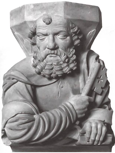
Abb. 4. Werkstatt Hans Gieng: Petrus, gegen 1554. Tafers, Pfarrkirche.