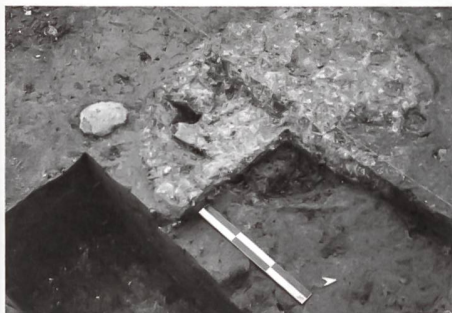
Fig. 1: Foyer de forge d'époque romaine mise au jour à Chevenez (JU) en mai 2012 sur le site de construction de l'unité de production TAGHeuer.

L'archéologie cantonale jurassienne est une jeune organisation qui compte trois collaborateurs «fixes», à temps partiel, et bénéficie d'un budget de fonctionnement modeste. En mai de cette année, elle a été confrontée à la découverte d'un site archéologique inconnu sur le chantier d'une usine horlogère à Chevenez, importante construction pour l'économie jurassienne qui s'étend sur une surface d'environ 2500 m 2 (fig.1). La découverte relève du hasard, due à un promeneur averti et non à des sondages préalables du service archéologique. Une fouille d'urgence a cependant pu être organisée, du personnel temporaire engagé, et les vestiges furent tous documentés, même si cela ne put pas toujours se faire