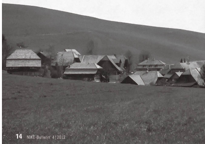
Strassenbau und Lärmschutz verändern Ortsbilder oft stark.