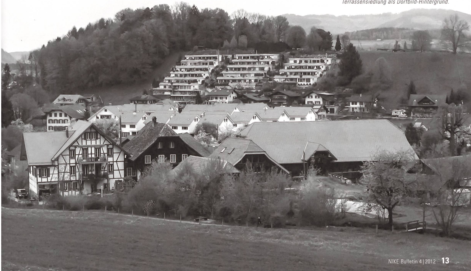
Terrassensiedlung als Dorfbild-Hintergrund.

Entscheidende Weichen bezüglich Ortsbildpflege werden im Verlauf von Ortsplanungen gestellt. Deshalb ist es eminent wichtig, die Anliegen der Denkmalpflege möglichst frühzeitig in den Planungsprozess einzubringen. Im Rahmen der Vorprüfung einer Ortsplanungsrevision erhält die Berner Fachstelle in der Regel erstmals die Gelegenheit Stellung zu nehmen. In einem Fachbericht – für den 30 Tage zur Verfügung stehen – kann die Denkmalpflege Neu- und Umzonungen, allfällige Schutzgebiete sowie die Bestimmungen des Baureglementes kommentieren und Änderungen beantragen. Dabei wird zwi-