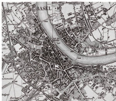
Siegfriedkarte 1882, 1:50 000

Grenzstadt in atemberaubender Lage beidseits des Rheinknies. Ausgedehntester mittelalterlicher Stadtkern der Schweiz. Gut ablesbares konzentrisches Wachstum. Kranz von grossstädtischen Wohnquartieren und Fabrikarealen, am Rand geordnete Reihenhausquartiere.