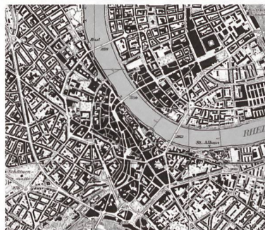
Landeskarte 2005, 1:50 000