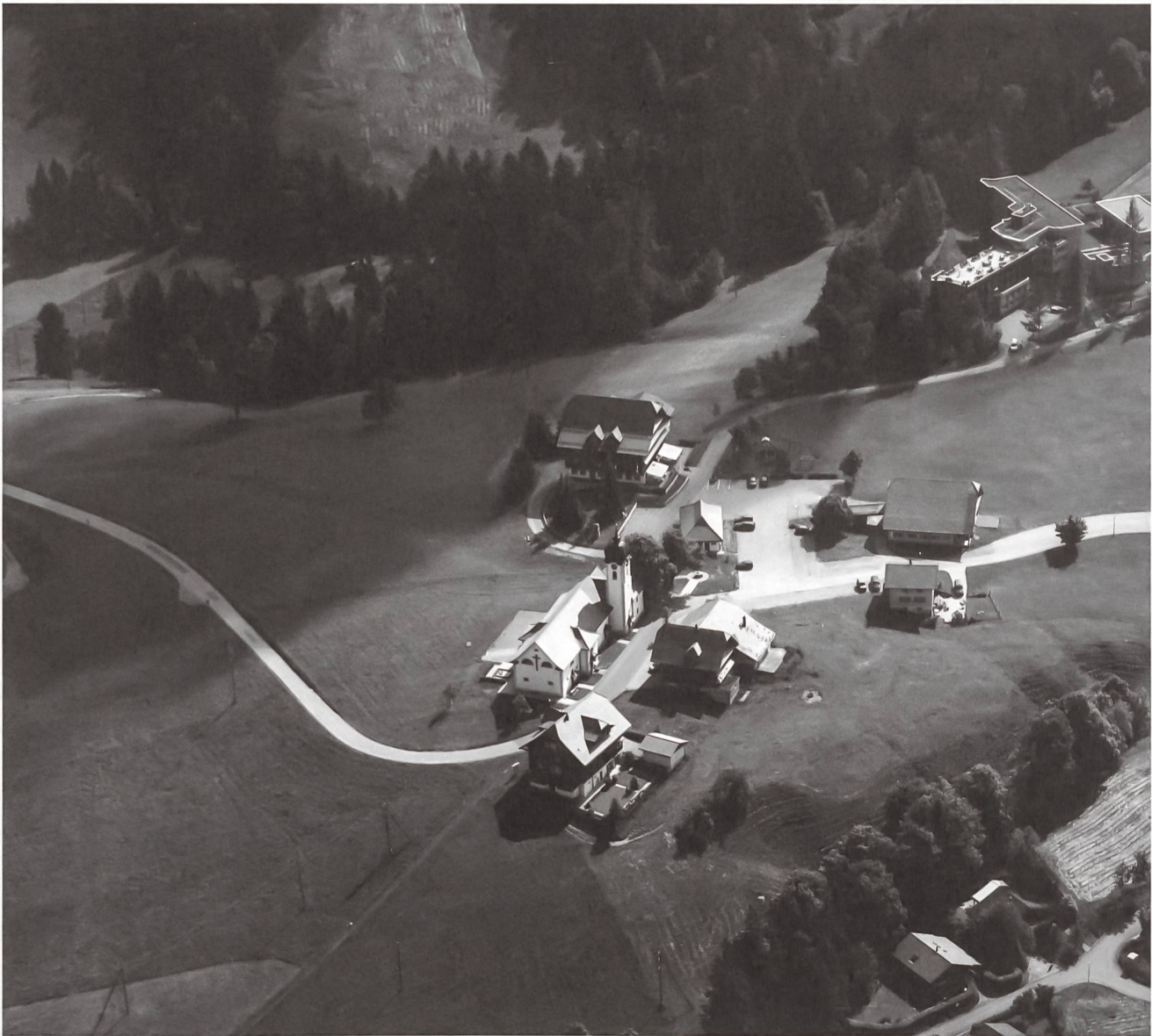
Flugbild Bruno Pellandini 2006 © Kantonale Denkmalpflege Luzern