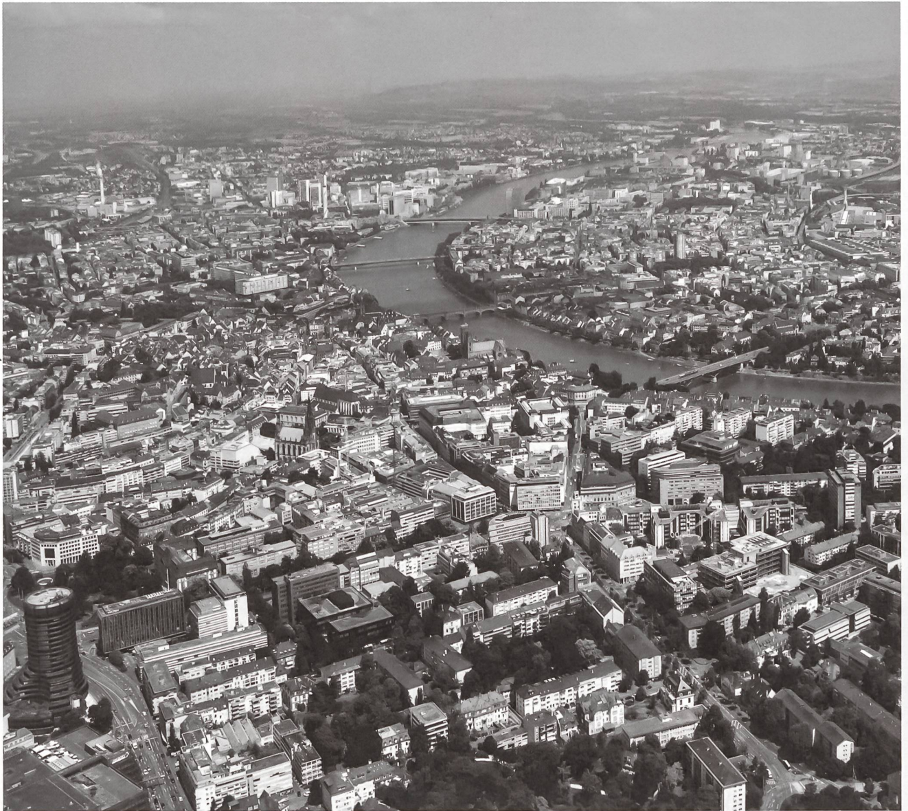
Flugbild Bruno Pellandini 2009, © BAK, Bern

Grenzstadt in atemberaubender Lage beidseits des Rheinknies. Ausgedehntester mittelalterlicher Stadtkern der Schweiz. Gut ablesbares konzentrisches Wachstum. Kranz von grossstädtischen Wohnquartieren und Fabrikarealen, am Rand geordnete Reihenhausquartiere.