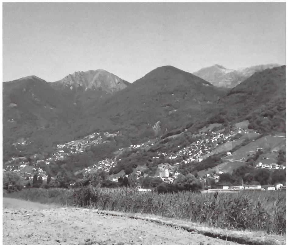
III. 2: Imbocco della Valle Verzasca, quasi invisibile dal Piano di Magadino.