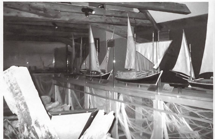
Les barques du Léman: en maquettes, elles racontent l'histoire de la navigation marchande du XV e siècle au présent.

Aus dem Inhalt: Architektur- und Kunstgeschichte in der Schweiz; La restauration «thématique»; Ortsbildschutz zwischen Substanzerhalt und Entwicklungsvisionen; Denkmalpflege – Blickpunkt Garten; La sauvegarde du patrimoine industriel récent; Translozierung – Eine Motivationsgeschichte an Fallbeispielen der Strickbauten in Appenzeln.