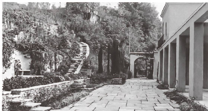
Garten der Villa Maggia, Turin, der um 1940 von Pietro Porcinai gestaltet wurde.

Historische Gärten unterliegen einem dauernden Wandel, sie sind geprägt durch ihre Zeitlichkeit und stellen Zeugnisse von überkommenen Gestaltungsphasen dar. Inwiefern sich gerade diese Eigenschaften mit persönlichen Lebenskonzepten verbinden lassen und dadurch den Erhalt bzw. Fortbestand bewirken, erörterte Anette Freytag von der ETH Zürich in ihrem Eröffnungsvortrag der Tagung. Sie veranschaulichte dafür zunächst die wechselvolle Geschichte der Gärten von Versailles, Wien, Potsdam etc. und bezog sich anschliessend auf das Ensemble La Gara bei Genf. Dort bemühen sich die derzeitigen Eigentümer, eigene Wünsche und Vorstellungen in die Grundstruktur zu integrieren.