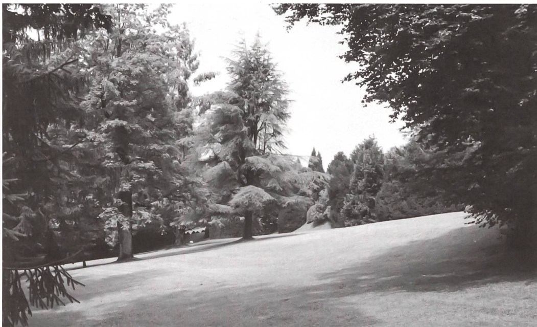
Der Schlosspark Meienberg mit seiner weitläufigen landschaftlichen Gestaltung.