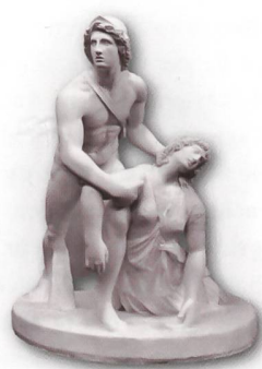
Achill und Penthesilea-Gruppe. Ernst Bergers Rekonstruktion mit Abgüssen von Fragmenten verschiedener römischer Repliken nach einem hellenistischen Vorbild (erste Rekonstruktionsvariante, 1964).

Die Skulpturhalle zeigt Ausstellungen zu aktuellen Forschungsthemen, etwa zur Farbigkeit antiker Skulptur.