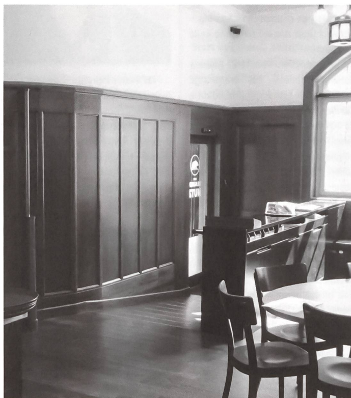
Le réaménagement de l'entrée permet dorénavant aux personnes à mobilité réduite d'accéder à l'auberge du «Brauner Mutz» à Bâle.

Historique et accessible? Oui, c'est possible!