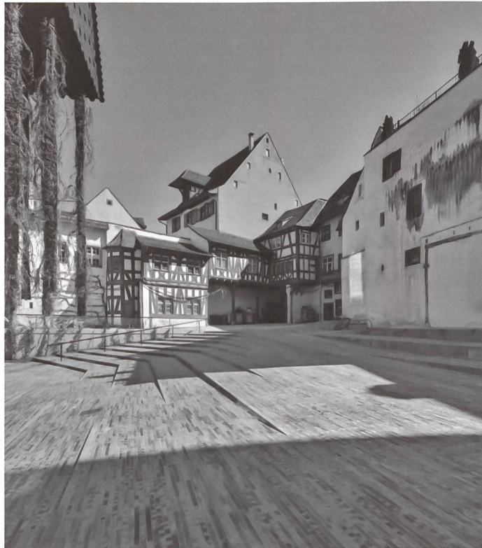
Fügt sich gut in die historische Umgebung ein: der sanft gestufte Eingangshof des Museums der Kulturen in Basel.