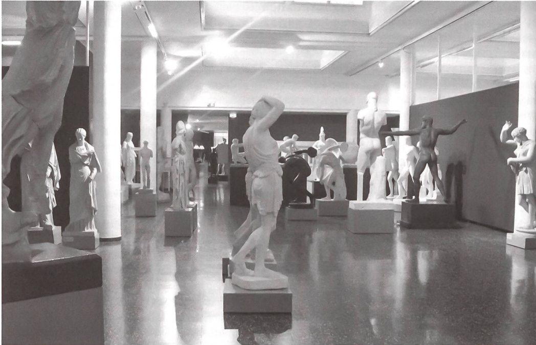
Die Skulpturhalle heute: Blick in den Hauptsaal.

Gipse erleiden und eine von 1927 bis 1963 dauernde Wartezeit in Magazinen und diversen Provisorien erdulden. Vordergründig zogen die Abgüsse deshalb aus der ohnehin viel zu klein gewordenen Skulpturhalle aus, weil deren Bau für die Zwischenlagerung der Gemäldesammlung des im Bau befindlichen Kunstmuseums (1937 fertiggestellt) beansprucht wurde und die Regierung der Skulpturhallenkommission das Versprechen gemacht hatte, die Gipse später in das vollendete Kunstmuseum einzugliedern. Diesen Vorschlag einer kombinierten Kunst- und Abguss-Sammlung kann man aus der damaligen negativen Beurteilung der Gipssammlungen heraus kaum nachvollziehen; entsprechend blieben die Gipse nach der Eröffnung des Kunstmuseums weiterhin magaziniert.