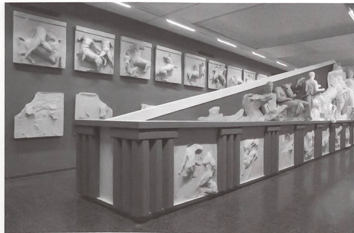
Die Parthenonausstellung in der Skulpturhalle an der Mittleren Strasse (nach der Renovation der Halle im Jahr 2006).

Musée des Monuments Français hiess. Dies konnte aber das seit dem frühen 20. Jahrhundert einsetzende Desinteresse am Gipsabguss nicht verhindern. Trotz imposanter architektonischer Komplexe fand das Museum im 20. Jahrhundert nur wenig Beachtung und seine Zukunft wurde wegen eines Brandes 1997 sogar in Frage gestellt. Heute ist seine Existenz gesichert, es lebt als Cité d'architecture weiter. Dem Crystal Palace war dieses Glück versagt: 1936 brannte er zu grossen Teilen ab, die verbliebenen Reste wurden im Krieg vollständig niedergegrissen. Heute lebt Crystal Palace nur noch als Name eines lokalen Fussballklubs weiter.