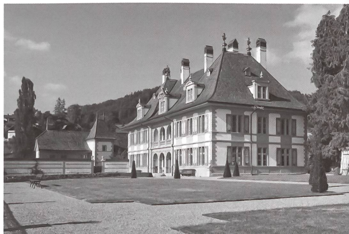
Ansicht von Schloss Oberdiessbach und einem Teil des rekonstruierten Parterres.

Dass es durch Nutzungsüberlagerungen und neue Anforderungen bei Eigentümerwechseln auch zu Schwierigkeiten kommen kann zeigten die Beispiele der Gärten um Schloss Wartegg am Bodensee und der Villa Patumbah in Zürich. Jeweils komplizierte Besitzverhältnisse prägten die Anlagen, kürzlich jedoch konnten vertretbar