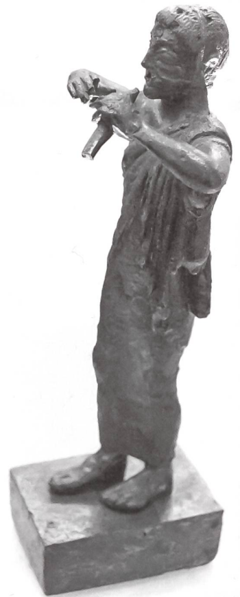
Bronzefigur eines Aulos-Spielers, aus einer korinthischen Werkstatt, 500–490 v. Chr.

Und hier beginnt die Geschichte, interessant zu werden. Zur Erziehung eines freien Athener Bürgers – also keines Fremden, keines Sklaven und auch keines Mädchens oder gar einer Frau – gehörte der Unterricht im Instrumentalspiel und Gesang. Die sieben-saitige lyra mit der Schale einer Schildkröte als Resonanzkörper galt als wertvoll, der doppelt geblasene aulós war nur zeitweise erzieherisch anerkannt. Auch wenn nun ein Athener gewisse instrumentale Fähigkeiten erworben hatte: