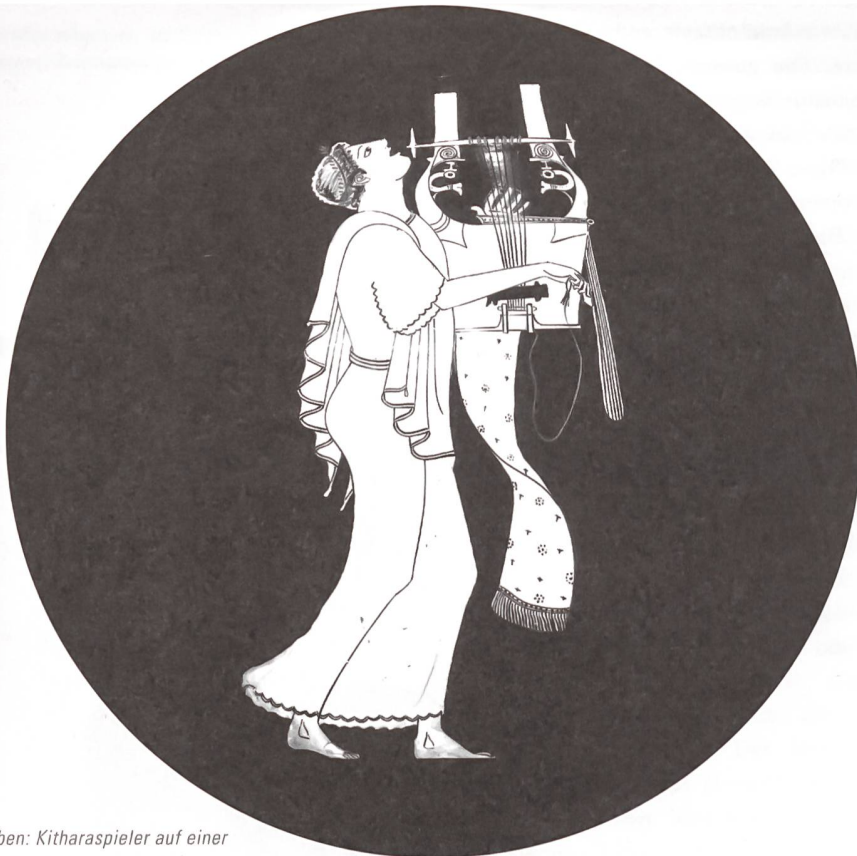
Oben: Kitharaspeler auf einer rotfigurigen, attischen Vase. Unten: Moderner Nachbau einer Kithara aus dem Atelier des Instrumentenbauers Paul Reichlin.