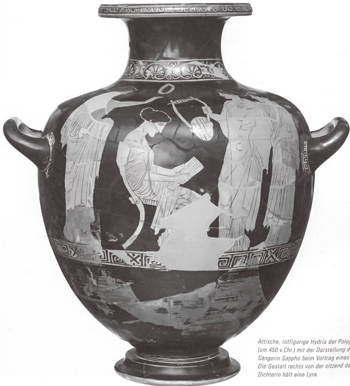
Attische, rotfigurige Hydria der Polygnotos-Gruppe (um 450 v.Chr.) mit der Darstellung der Dichterin und Sängerin Sappho beim Vortrag eines ihrer Gedichte. Die Gestalt rechts von der sitzend dargestellten Dichterin hält eine Lyra.