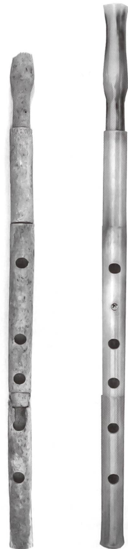
Links: Originaler aulós aus Hirschknochen, aus Paestum. Rechts: Nachbau aus Hirschknochen, mit Leinöl behandelt

ten Hand über einzelne Saiten führte. Damit nicht stets alle Saiten zur selben Zeit in Schwingung versetzt wurden, mussten die Finger der linken Hand die anderen Saiten dämpfen. Diese Art «Negativtechnik», wo als Ausgangslage die fünf Finger auf den Saiten liegen und nur bei Bedarf einzeln aufgehoben werden, finden wir nicht nur auf zahlreichen Vasen deutlich abgebildet; sie ist noch stets lebendig im heutigen Ägypten auf vergleichbaren Instrumenten wie tambura oder semsemeia , ebenso auf dem äthiopischen kharrar . Ein sowohl kraftvolles wie auch rhythmisch prägnantes Spiel wird die Folge dieser instrumententypischen Spielweise gewesen sein.