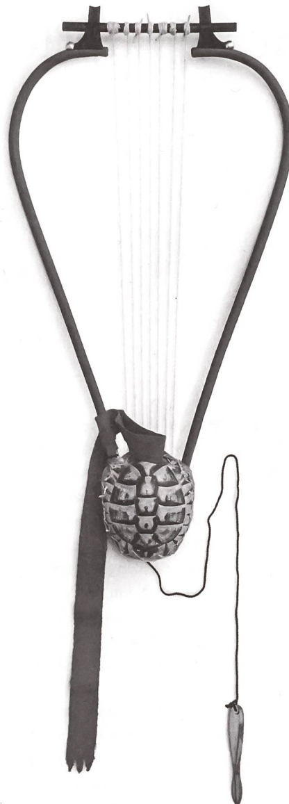
Moderner Nachbau eines Barbitos.