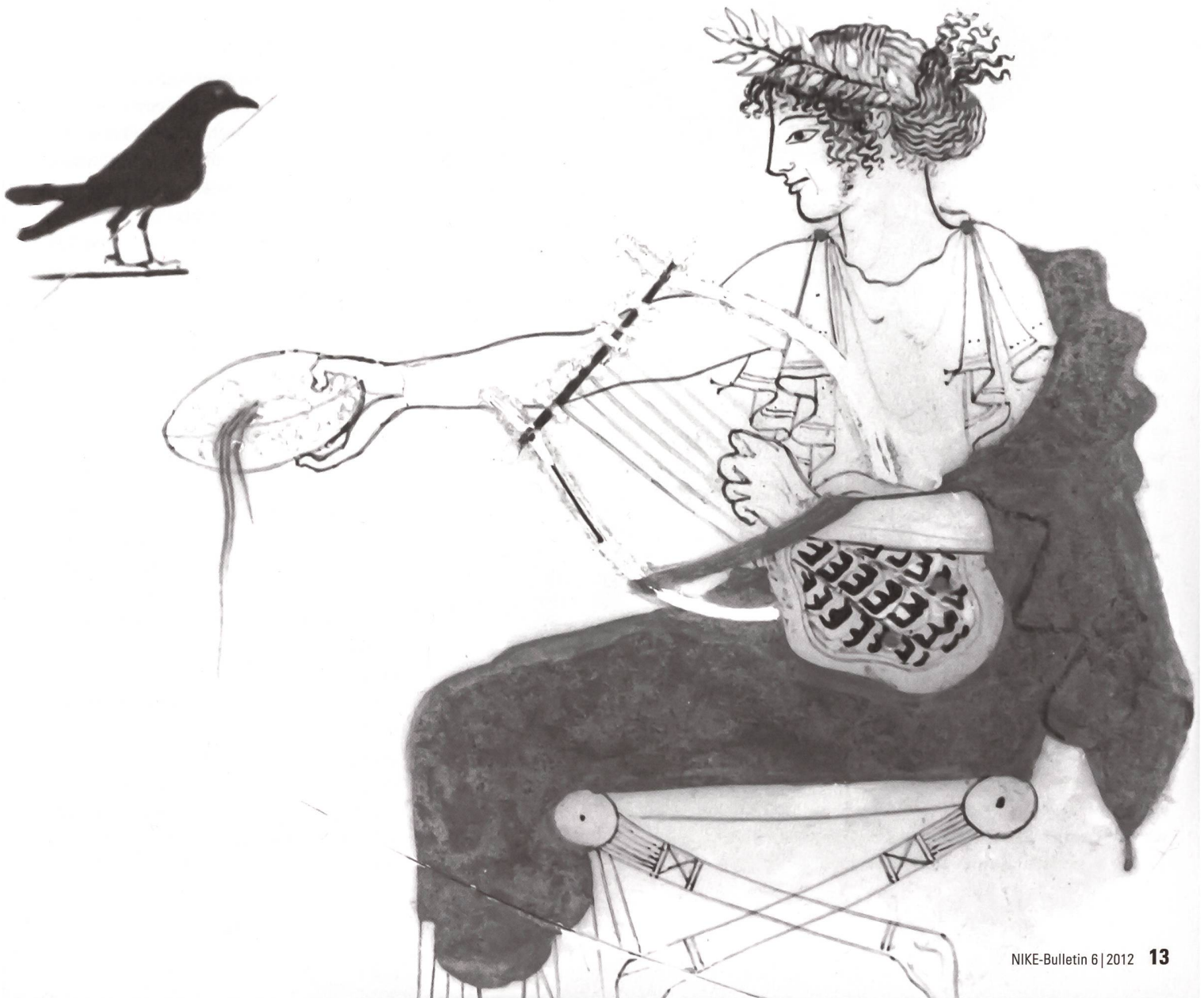
Darstellung des Gottes Apoll mit einer Lyra auf einer attischen Kylix (Trinkschale), um 480–470 v. Chr.

wurde, was kein oktavierendes Überblasen erlaubte. Die gesamte Disposition ergab ein dynamisch gleichförmiges, aber melodisches und zudem immer zweitöniges Spiel. Diese Zweitönigkeit konnte zustande kommen, indem eine Röhre einen Halton (Bordun) spielte, oder indem beide Röhren sich in einem gewissen Rahmen melodisch bewegten. Formelhaftigkeit der Ausdrucksweise wird in jedem Fall auch hier eine grosse Rolle gespielt haben. Diese Art Klang und Spiel finden wir noch heute, wiederum in Ägypten, auf den Instrumenten magruna und arghoul , ebenso wie auf der sardischen launeddas . Es sind Techniken und Ausdrucksweisen, die eine