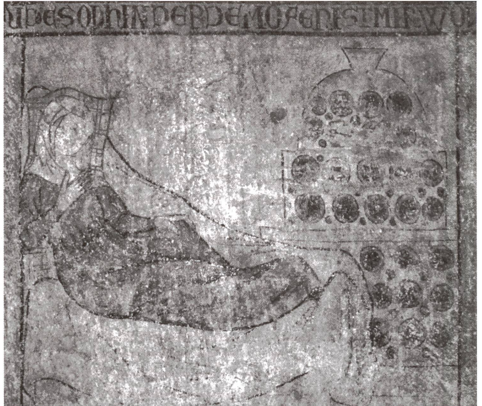
Abb. 3: Konstanz, Haus zur Kunkel, erbaut 1319/1320 (dendrochronologische Datierung), Fresko mit Kachelofendarstellung.

chelblatt – gegen den Raum hin orientiert. Zudem wurden die Schauseiten der Pilzkacheln und der Tellerkacheln erstmals und für die Zukunft richtungweisend mittels Modeltechnik verziert, so dass sich ab dem zweiten Drittel des 14. Jahrhunderts für die Kachelöfen verschiedenste Gestaltungsmöglichkeiten eröffneten (Abb. 5).