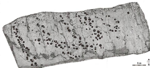
Abb. 2: Verzerrungsfreie und massstabgetreue Abbildung (Orthofotografie) der bei Courtedoux – Bois de Sylleux (JU) entdeckten Dinosaurierspuren.

Besonders eindrücklich zeigte sich dies beim Bau der Transjurane-Autobahn (A16): Alleine bei den Grabungen im Abschnitt zwischen dem Creugenat-Viadukt und dem Tunnel von Bure wurden über 50 000 Fossilien geborgen und rund 14 000 Dinosaurier-Fussabdrücke dokumentiert. Letztere bezeugen, dass sich die Tiere vor 152 Millionen Jahren an den Stränden des Jurameers aufhielten und im Kalkschlamm ihre Spuren hinterlassen haben (Abb. 2). Für die Besucherinnen und Besucher sind die an Ort und Stelle konservierten Dinosaurierspuren beeindruckend (vgl. www.paleojura.ch ), der Fachwelt bieten die grossflächig erhaltenen Fussabdrücke Gelegenheit, den noch kaum