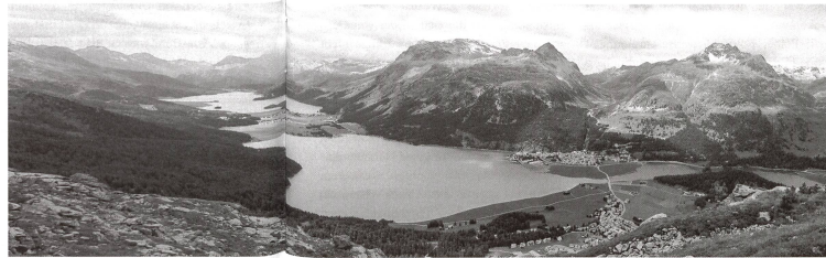
Abb. 4: Die Engadiner Seenlandschaft – ein natur- und kulturgeschichtliches Bodenschichtarchiv per excellence.

sive Zunahme der Baumpollen feststellbar. Offensichtlich hat das auch andernorts feststellbare Nachlassen der Siedlungsaktivitäten bzw. der Nutzungsintensität an diesen Epochenübergängen dazu geführt, dass sich der Wald erholen konnte. In der karolingischen Zeit (9. und 10. Jh.), im Mittelalter und in der Frühen Neuzeit führte der Raubbau dann zur fast vollständigen Entwaldung des Engadins. Diese erreichte in der Zeit um 1700 ihren Höhepunkt, seither nimmt der Baumbestand – u.a. wegen der Umstellung auf fossile Brennstoffe und Strom sowie wegen entsprechender Schutzmassnahmen – wieder zu.