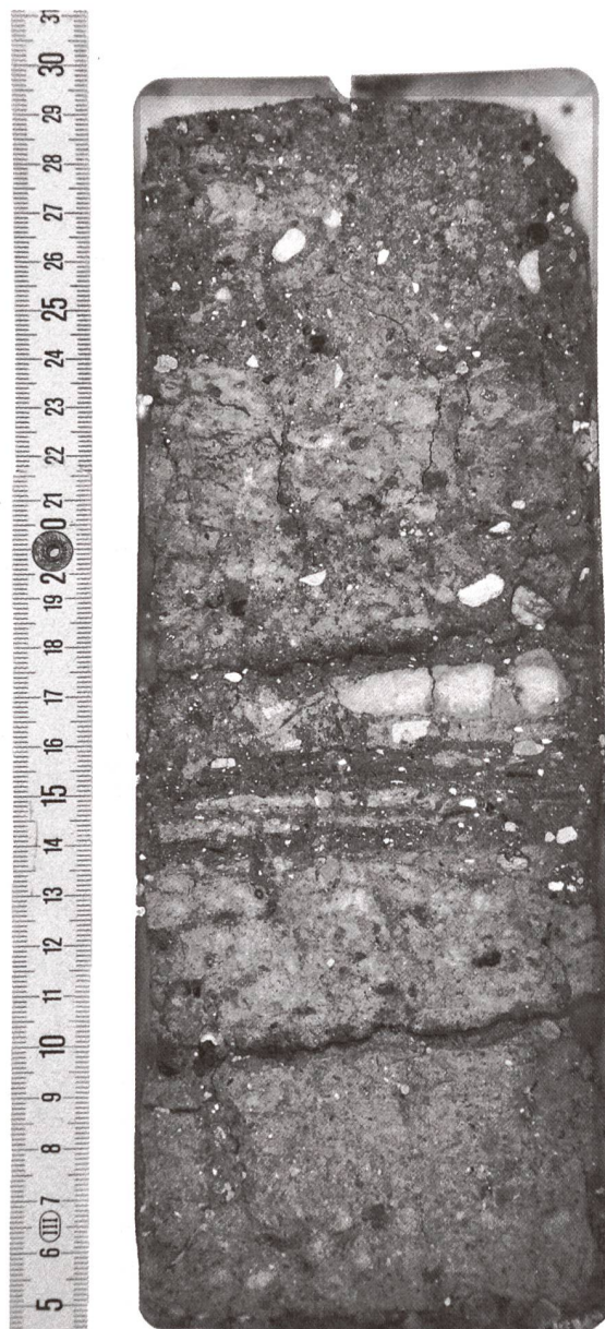
Abb. 6: Fotografie einer Sedimentprobe aus der Unterstadt von Augusta Raurica (Kaiseraugst/AG). Mikromorphologische Untersuchungen solcher «Mikro-Stratigraphien» erlauben einerseits eine Unterscheidung zwischen natürlichen und anthropogen entstandenen Schichten und liefern andererseits auch zusätzliche und detaillierte Informationen zu den menschlichen Aktivitäten.

es auf den archäologischen Ausgrabungen unabdingbar, nicht nur die Fundobjekte zu bergen, sondern auch die genaue Fundlage der einzelnen Objekte zu dokumentieren. Die während der Ausgrabungen erstellte Dokumentation (massstäbliche Zeichnungen, Pläne, Fotografien, Beschreibungen etc.) bildet folglich eine unabdingbare Kompensations- bzw. Ersatzmassnahme, weil das Archiv im Boden durch die Baumassnahmen unwiederbringlich zerstört wird.