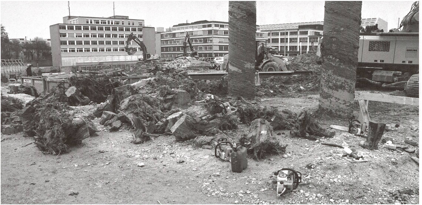
Abb. 1: Beprobung der in Zürich gefundenen, rund 13 000 Jahre alten Baumstämme aus dem Sihlwald.

schlüsse über das damalige Klima und die Luftzusammensetzung ermöglicht. Mit Hilfe von DNA-Analysen wird es vielleicht sogar möglich sein, die Abstammung der Kiefern zu verfolgen.