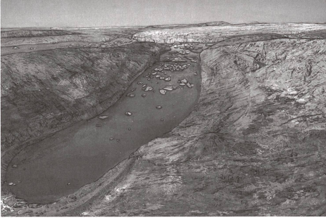
Abb. 3: Das Wehental vor etwa 180 000 Jahren. Der abschmelzende Gletscher hinterliess hier und im unteren Glatttal über 150 Meter tiefe Seebecken.

Moore bilden aber auch das Bindeglied zwischen der Naturgeschichte und der menschlichen Kulturschichte. So hat beispielsweise die Untersuchung von Sedimenten aus den Hochmooren bei Maloja und aus den beiden Oberengadiner Seen (Abb. 4) gezeigt, dass das heute nahezu baumlose Hochtal im Zeitraum zwischen 4200 und ca. 3550 v. Chr. noch dicht bewaldet war – der «Urwald» bestand vornehmlich aus Fichten, Wald- und Bergföhren, Arven und Lärchen. Die Zunahme von Kulturzeigern (Pollen von Farnen und Gräsern), zeigt, dass die ersten Eingriffe in den Waldbestand während der Jungsteinzeit (um ca. 3500 v. Chr.) erfolgten. Zu tiefgreifenden Veränderungen kam es dann in der frühen Bronzezeit (um 2000 v. Chr.): Die menschlichen Aktivitäten führten zu einer deutlichen Auflockerung der Bewaldung bzw. zu einer Zunahme von Weide- und Kulturzeigern, aber auch zu einer starken Ausbreitung der Grünerle und der Lärche.