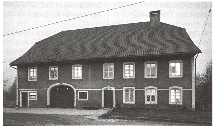
Das prämierte Bauernhaus steht im Kern des Juradorfs Cortébert.