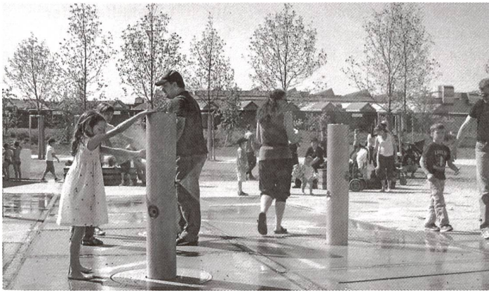
Früher ein Güterbahnhof, jetzt ein neues Stadtquartier: Mensch und Natur sollen im Basler Erlenmattpark in engem Kontakt stehen.