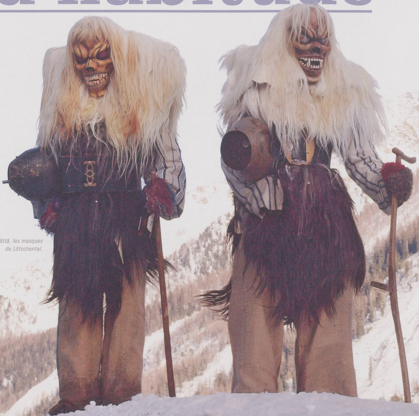
Tschägättä, les masques de Lötschental.