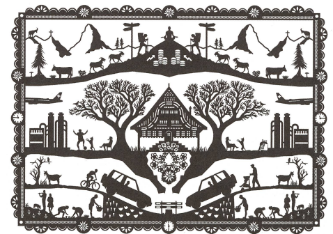
... et par Christine Kälin du présent.

rieuse nous interdit de reprendre cette idée à notre compte, d'abord parce que d'autres manières de faire et d'être, totalement opposées, nous caractérisent également (pensons aux superbes peintures «naïves» et «rustres» que sont les poyas), ensuite parce que d'autres sociétés font preuve des mêmes compétences de précision, de minutie et de soin (pour s'en convaincre, il suffit de comparer les papiers découpés chinois au découpes du Pays d'Enhaut).